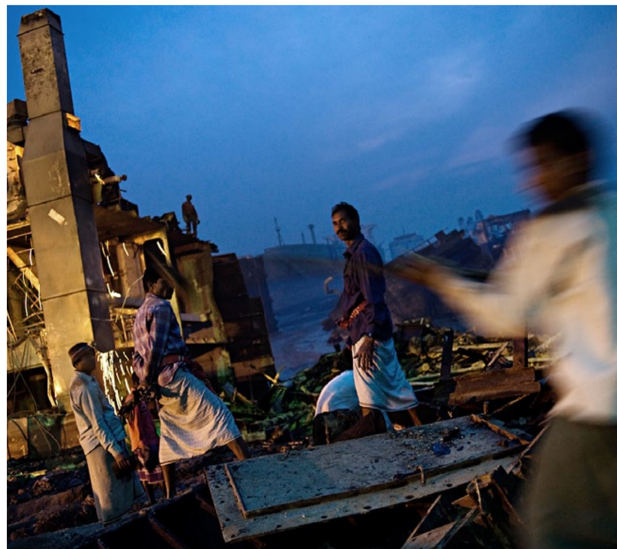
Ju värre skick fartygen är i, desto mer pengar går det att tjäna på dem.