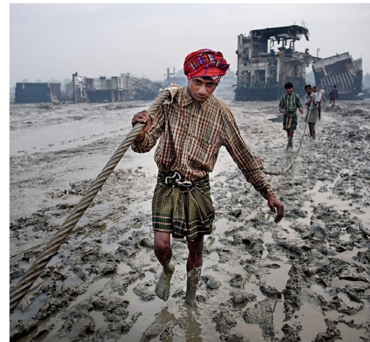
Det pågår en febril aktivitet på stranden, hundratals svetsare och hjälpare är i färd med att plocka isär ett fartyg.