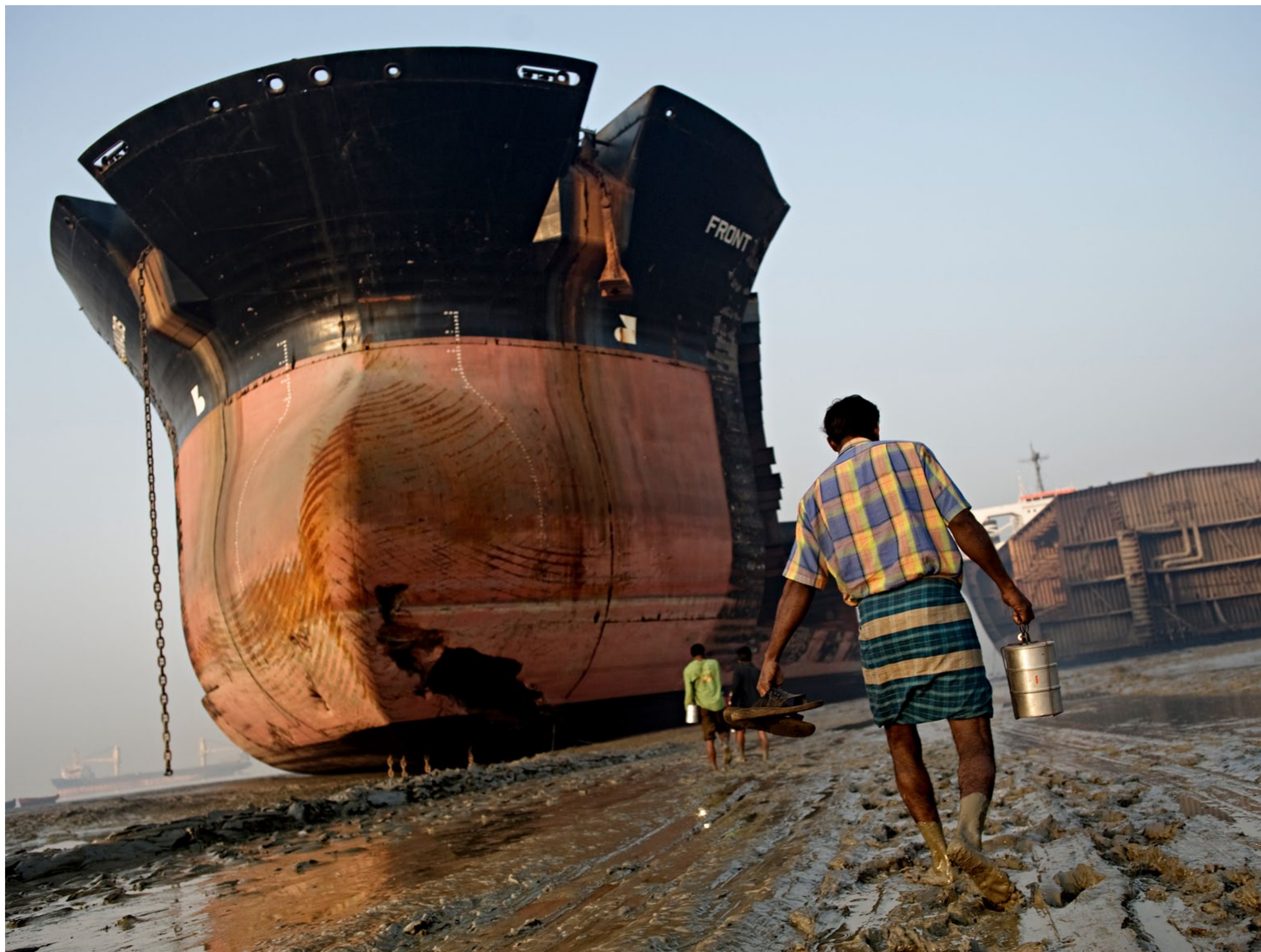
Olja läcker från fartygen och förorenar vattnet. Fiskare som brukade fiska intill stranden måste bege sig långt ut till havs för att få någon fångst.