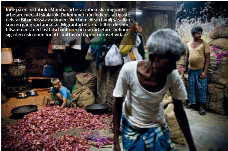
Inne på en lökfabrik i Mumbai arbetar inhemska migrantarbetare med att skala lök. De kommer från Indiens fattigaste delstat Bihar. Vissa av männen åker hem till sin familj så sällan som en gång vartannat år. Migrantarbetarna tillhör de som, tillsammans med lastbilschaufförer och sexarbetare, befinner sig i den riskzonen för att smittas och sprida viruset vidare.