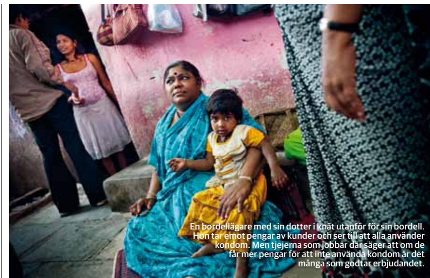
En bordellägare med sin dotter i knät utanför för sin bordell. Hon tar emot pengar av kunder och ser till att alla använder kondom. Men tjejerna som jobbar där säger att om de får mer pengar för att inte använda kondom är det många som godtar erbjudandet.