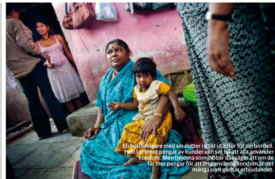
En bordellägare med sin dotter i knät utanför för sin bordell. Hon tar emot pengar av kunder och ser till att alla använder kondom. Men tjejerna som jobbar där säger att om de får mer pengar för att inte använda kondom är det många som godtar erbjudandet.