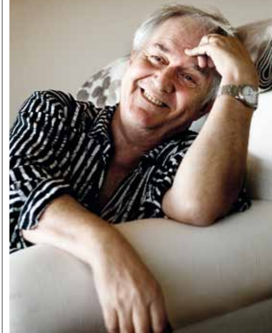
Indiens befolkning ökar med ett netto av 50 barn i minuten. "Hur ska man kunna försvara den indiska demokratin om den visar sig inkapabel att förhålla sig till denna explosion av nya människor?", frågar sig Henning Mankell.

den där natten mellan Jaipur och New Dehli bekräftade detta.