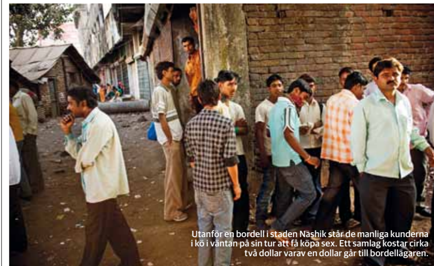
Utanför en bordell i staden Nashik står de manliga kunderna i kö i väntan på sin tur att få köpa sex. Ett samlag kostar cirka två dollar varav en dollar går till bordellägaren.