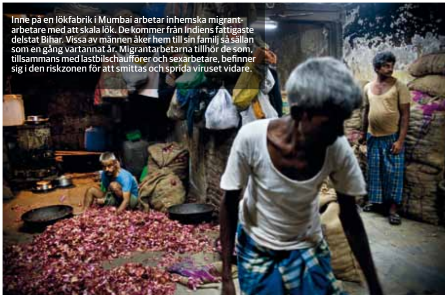
Inne på en lökfabrik i Mumbai arbetar inhemska migrantarbetare med att skala lök. De kommer från Indiens fattigaste delstat Bihar. Vissa av männen åker hem till sin familj så sällan som en gång vartannat år. Migrantarbetarna tillhör de som, tillsammans med lastbilschaufförer och sexarbetare, befinner sig i den riskzonen för att smittas och sprida viruset vidare.