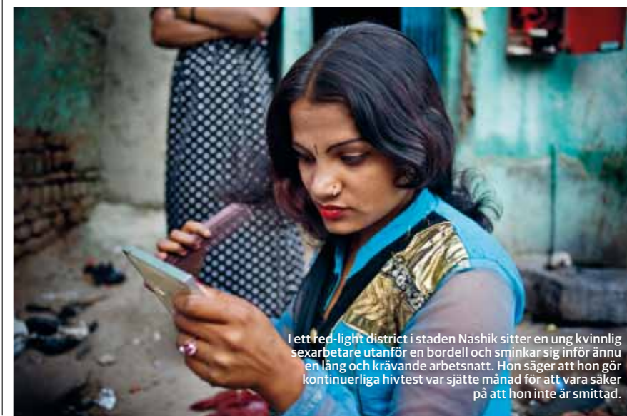
I ett red-light district i staden Nashik sitter en ung kvinnlig sexarbetare utanför en bordell och sminkar sig inför ännu en lång och krävande arbetsnatt. Hon säger att hon gör kontinuerliga hivtest var sjätte månad för att vara säkra på att hon inte är smittad.