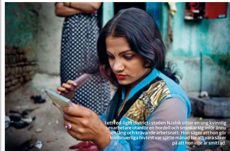
I ett red-light district i staden Nashik sitter en ung kvinnlig sexarbetare utanför en bordell och sminkar sig inför ännu en lång och krävande arbetsnatt. Hon säger att hon gör kontinuerliga hivtest var sjätte månad för att vara säkra på att hon inte är smittad.