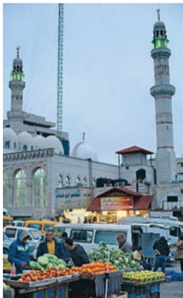
Ramallah: Några kvinnor välkomnar utanför en moské. Falafel är vanligt förekommande på stans menyer och servicen uppmärksam. Färsk frukt och grönsaker inhandlas på någon av de många marknaderna och kaféer och restauranger byggs i rasande fart i Ramallahs centrala delar.

på vintern. Allt började här – och allt kommer att sluta här.