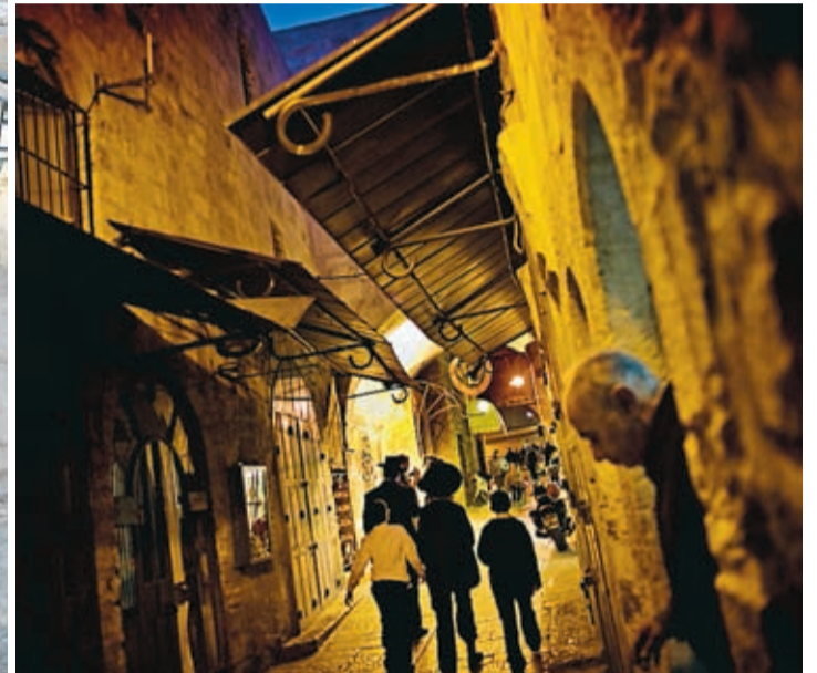
Jerusalem: Uppå Olivberget berättar en guide om stadens historia. Utsikten är vid, med Klippdomens guldakupol i bakgrunden. En palestiniere pausar efter en arbetsdag i Gamla staden. Vid Västra muren, eller Klagomuren som den också kallas, samlas troende judar för att be. De gamla kvarteren är en labyrinth av gångar och trånga gränder.