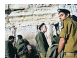
Israeliska soldater vid Klagomuren.

Bo i centrala Ramallah: Al-Wihdeh Hotel. Al-Nahda Street, Al-Manara. Mycket enkelt hotell,