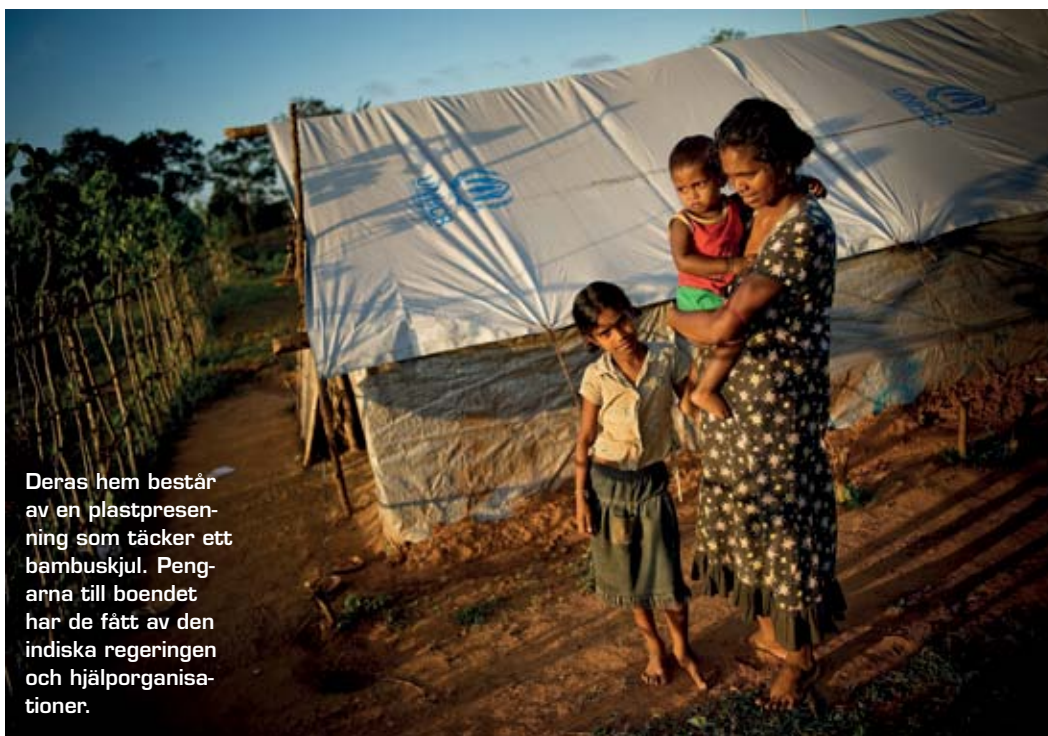
Deras hem består av en plastpresening som täcker ett bambuskjul. Pengarna till boendet har de fått av den indiska regeringen och hjälporganisationer.