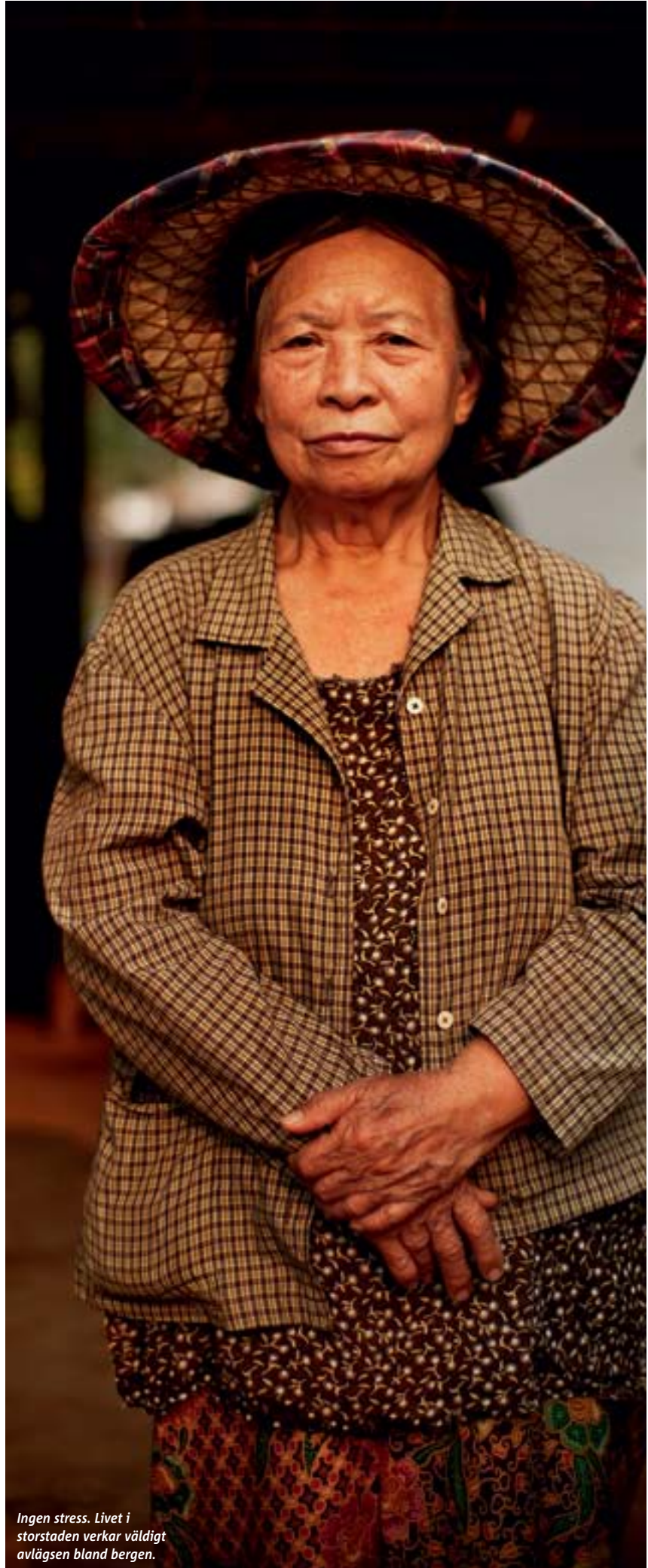
Ingen stress. Livet i storstaden verkar väldigt avlägsen bland bergen.