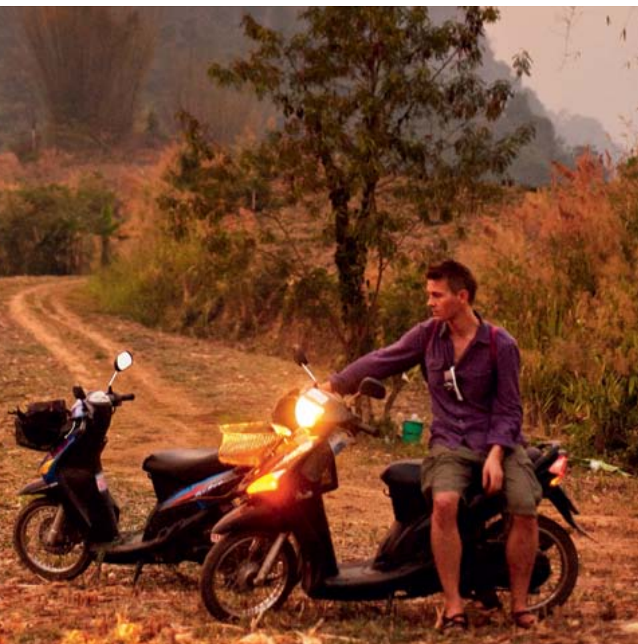
Vilopauser med jämna mellanrum är bra för att kunna ta in omgivningarna.

Genomströmda avgifter • Små grupper • Hållbara resor