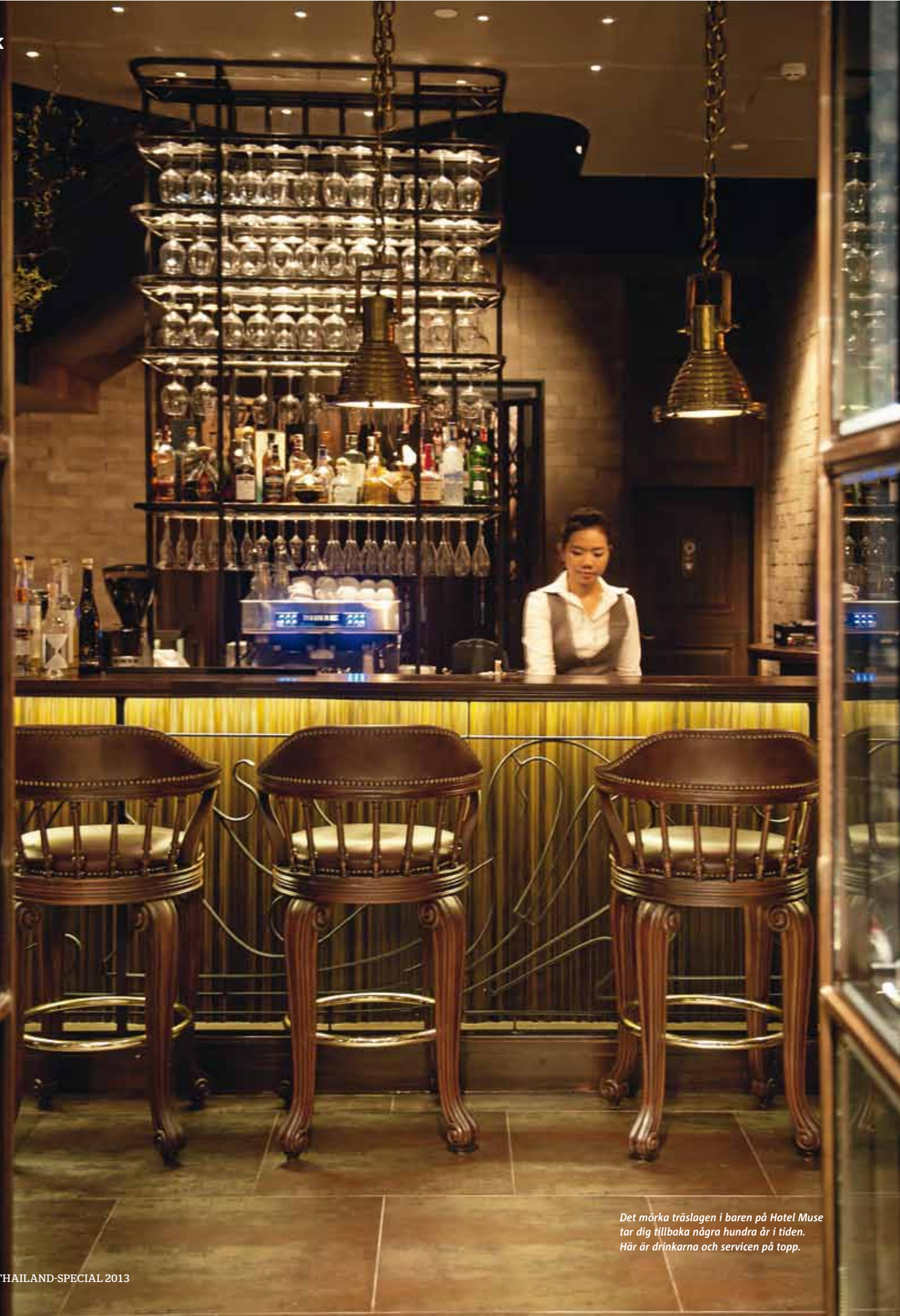
Det mörka träslagen i baren på Hotel Muse tar dig tillbaka några hundra år i tiden. Här är drinkarna och servicen på topp.