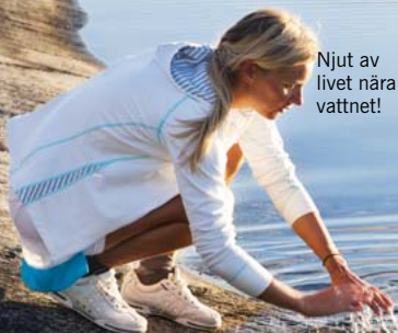
Njut av livet nära vattnet!

GLÖM INTE SEMAFOREN Den runda blåbara skylten på bryggan, ska vara i lodrät läge när du väntar på båten ut i skärgården. Det är en signal till kaptenen att rådon vill stiga ombord. Är det mörkt behöver du ha en ficklampa att blinka med.