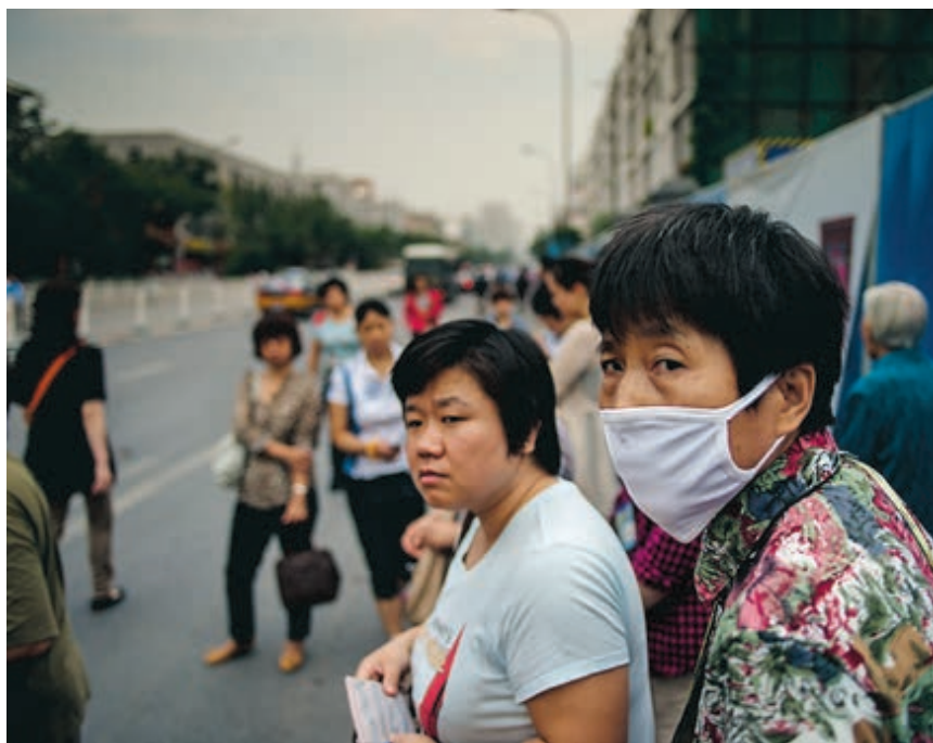
Runt om i centrala Peking har andningsskydd blivit en vanlig syn.