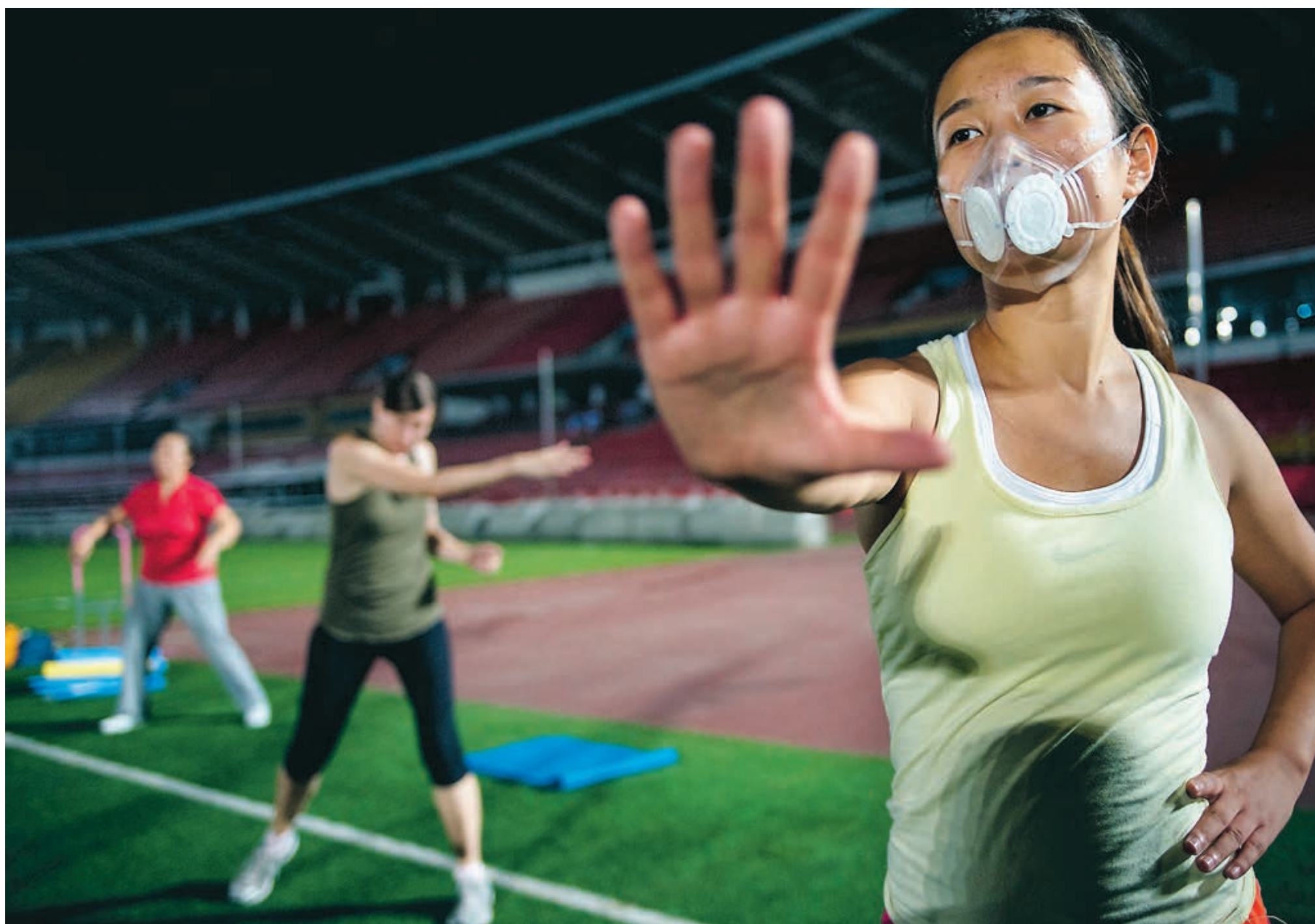
Under ett jympapass på Arbetarstadion i Peking bär en av deltagarna en skyddsmask för att stänga ute hälsofarliga PM2,5-partiklar.