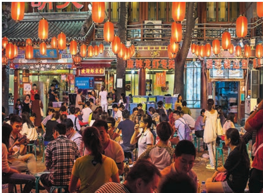
På de populära utomhusrestaurangerna i Pekings gamla, smala gränder märks det att antalet utländska besökare minskar.