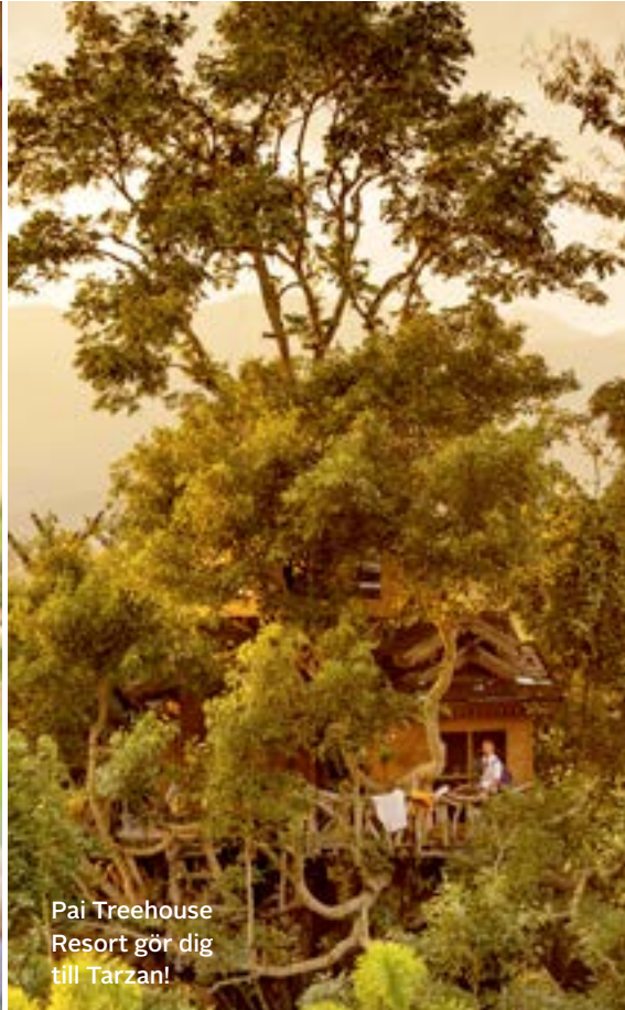
Pai Treehouse Resort gör dig till Tarzan!