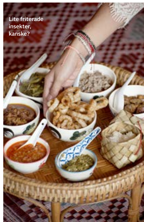
Lite friterade insekter, kanske?