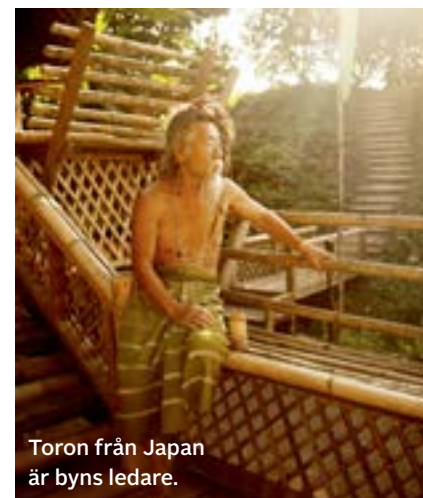
Toron från Japan är byns ledare.

Intill ett stort grönsaksfält, där salladshuvuden bildar praktfulla ljusgröna rader, står ett stort tipi utsträckt, målat i olika färger, och lite längre bort ligger ett konstgalleri – där dörren står på vid gavel. Byggnaden är tom på människor och på väggarna hänger konstverk som föreställer hinduiska gudar som Ganesha målade i kraftfulla pasteller – en färgexplosion för ögonen. Okej, det här börjar bra, en blandning mellan vilda västern och Indien mitt bland bergen i nordvästligaste Thailand!