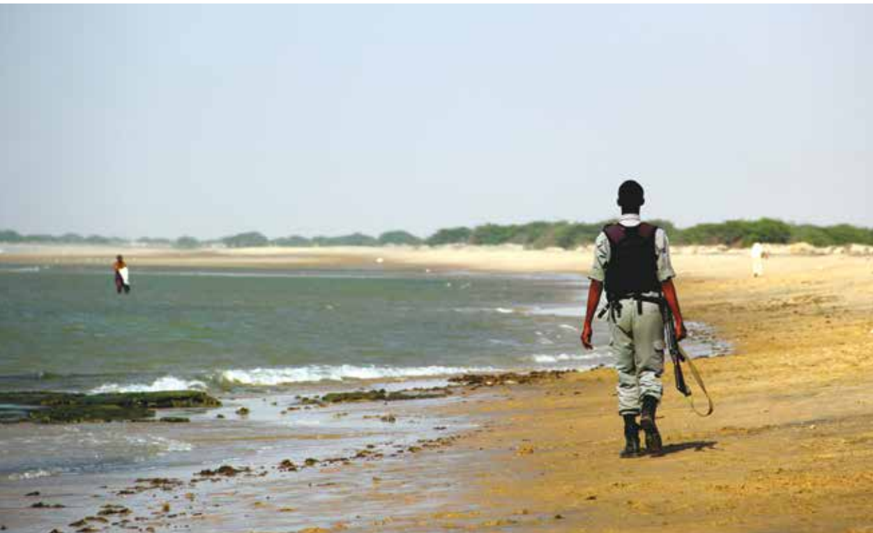
En soldat patruljerer stranden ved havnebyen Berbera. Over halvparten av landets BNP går hvert år til militære utgifter. Somaliland har større trygghet og sikkerhet enn Somalia, høy arbeidsledighet medfører økning i kriminalitet.