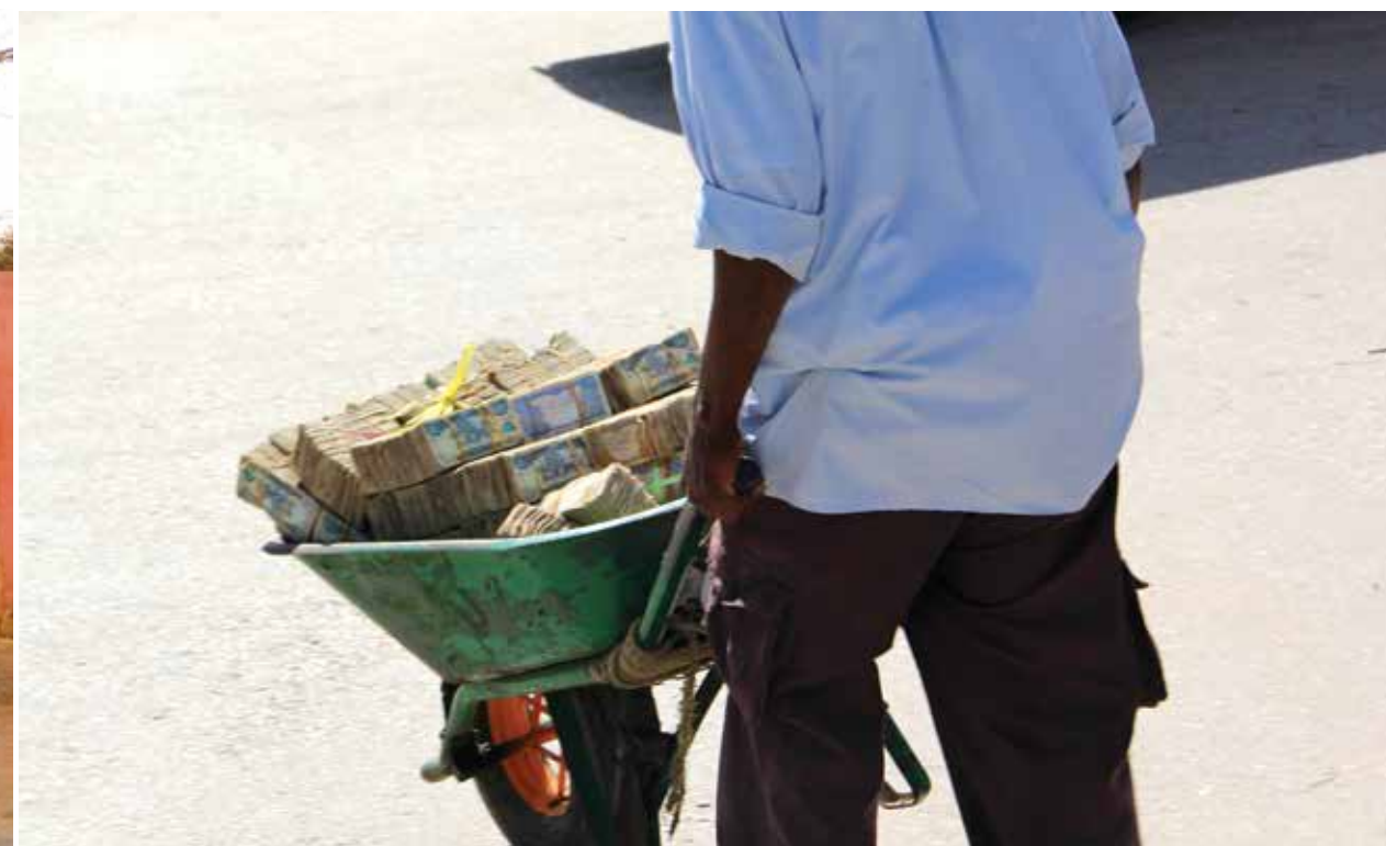
Ettersom verden ennå ikke har anerkjent den nordvestre delen av Somalia som eget land, uteligger utenlandske investeringer og etableringer. Somalilands egen valuta, soamlishilling , er ikke internasjonalt anerkjent. Kursen varierer kraftig, og valutaen fraktes gjerne i trillebår.