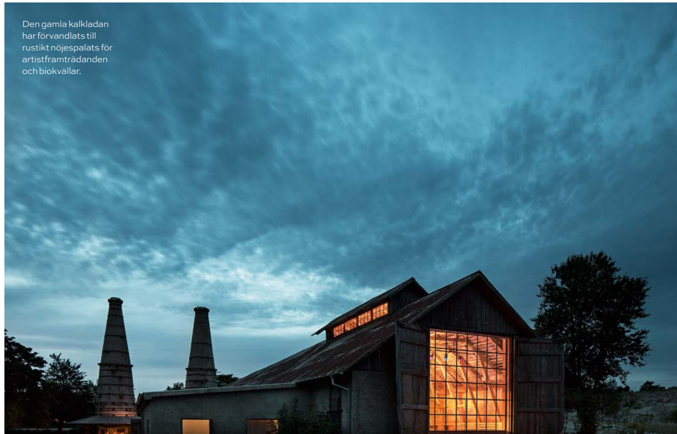
Den gamla kalkkladan har förvandlats till rustikt nöjespalats för artistframträdanden och biokvällar.