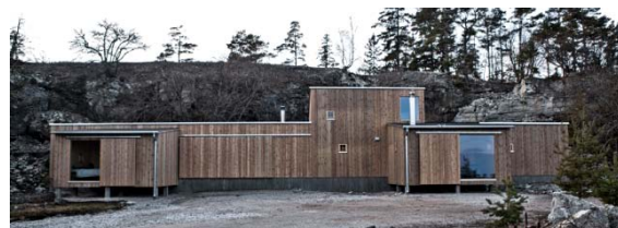
Österklint 20 är anpassat till naturens strandskydd och brottkant.