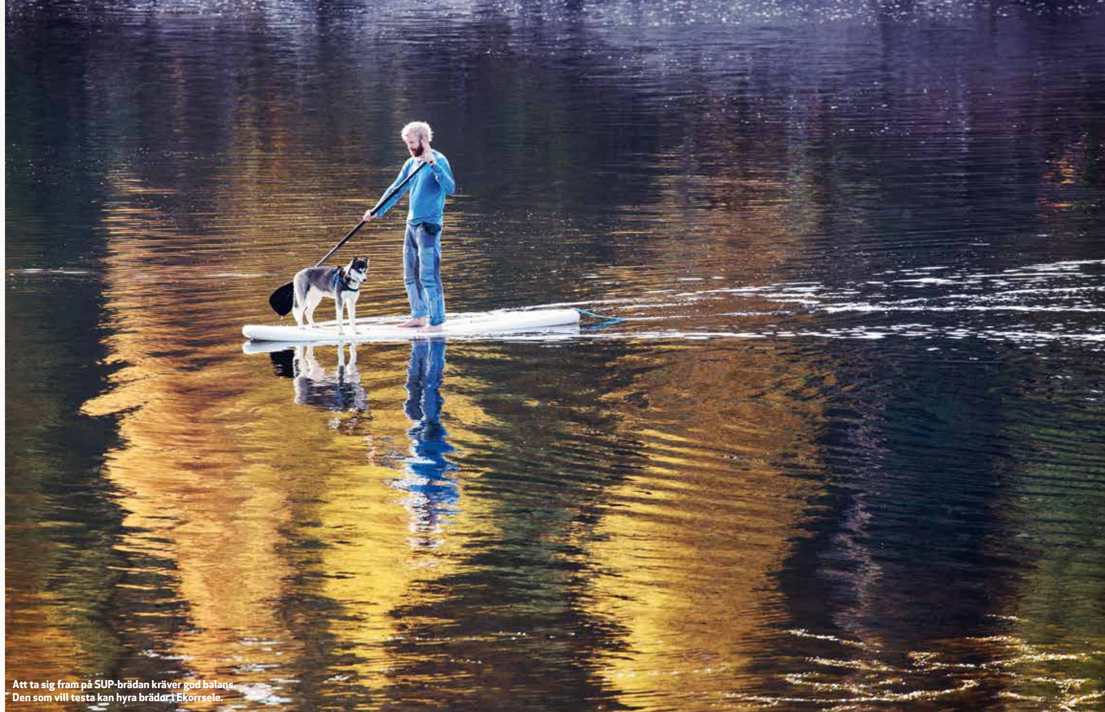
Att ta sig fram på SUP-brädan kräver god balans. Den som vill testa kan hyra brädor i Ekorssele.

– Att sova i en bivack med trötta hundar är en skön upplevelse. Det ger mig ett rikt liv. ◀