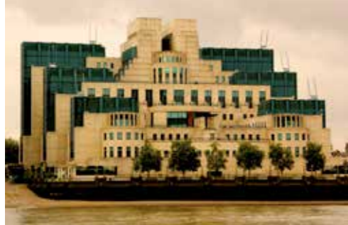
Huset som är Mi6:s huvudkontor i filmen.