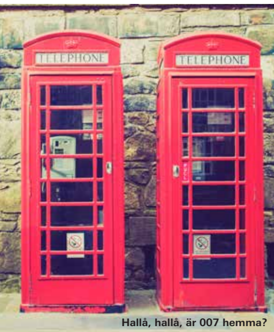
Hallå, hallå, är 007 hemma?