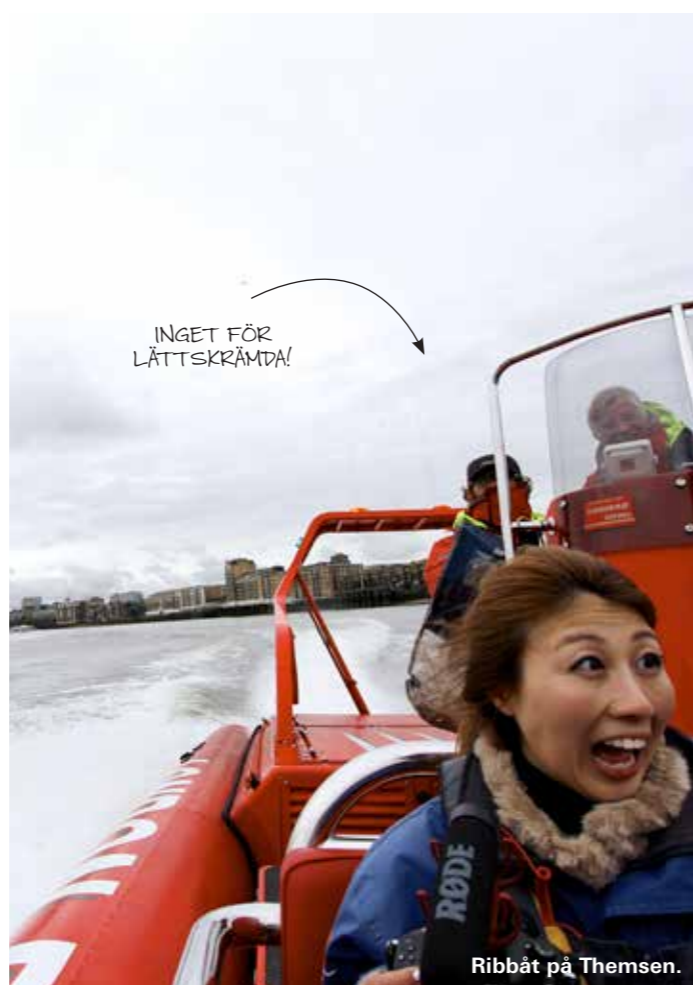
Ribbåt på Themsen.