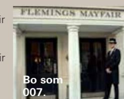
Bo som 007.