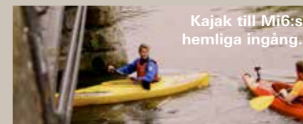
Kajak till Mi6:s hemliga ingång.