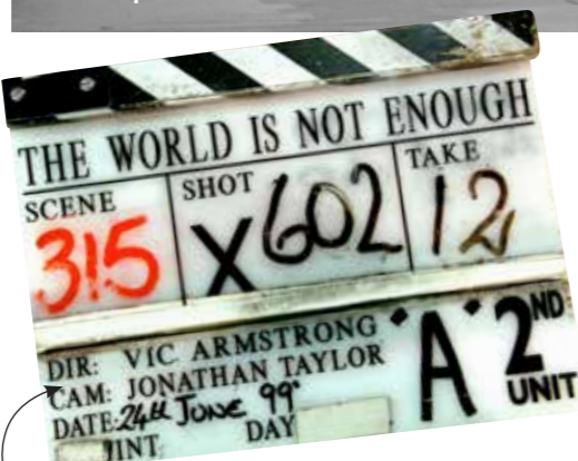
REKVISITA PÅ BOND MUSEUM.