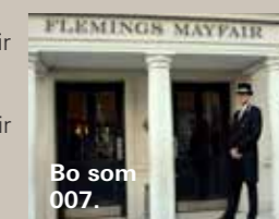
Bo som 007.