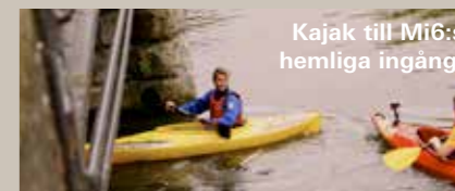
Kajak till Mi6:s hemliga ingång.