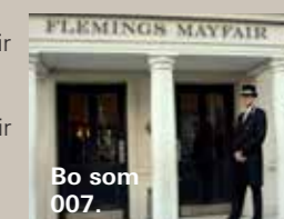
Bo som 007.