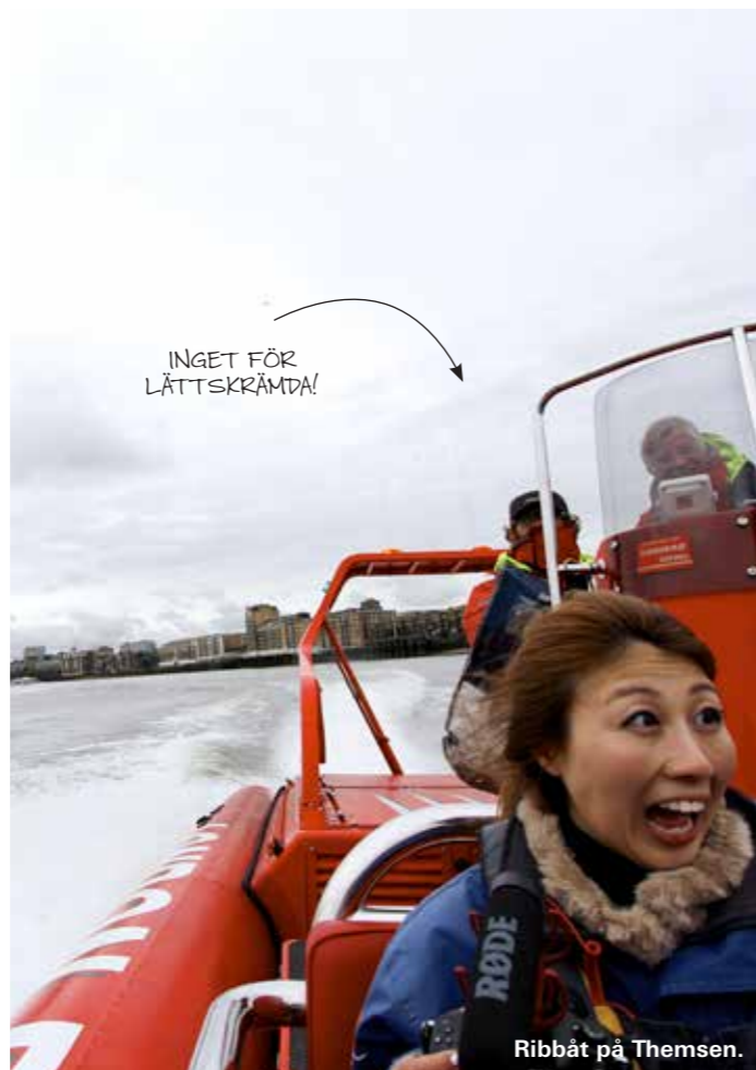
Ribbåt på Themsen.