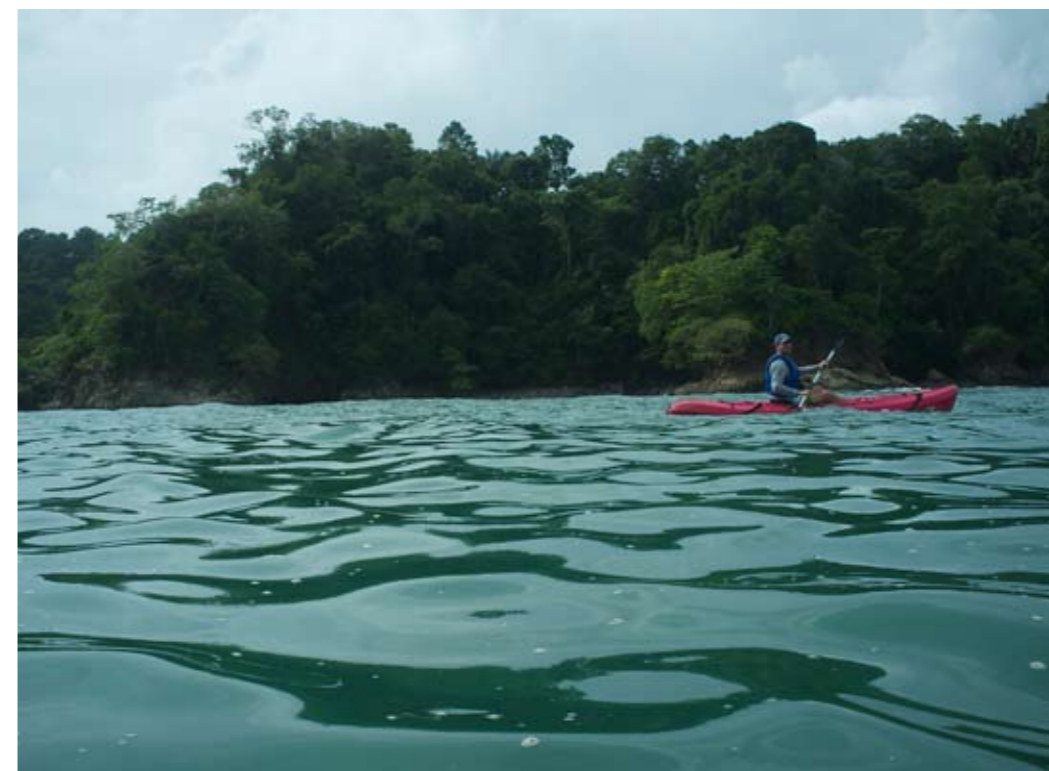
Havskajak är ett bra sätt att se nationalparkerna längs kusterna.