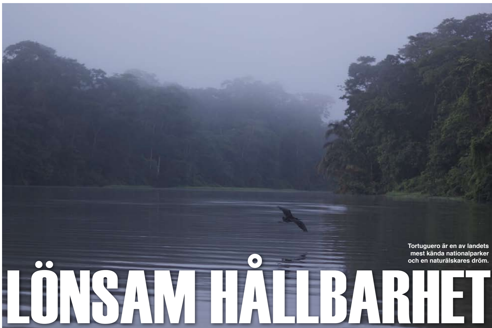
Tortuguero är en av landets mest kända nationalparker och en naturälskares dröm.