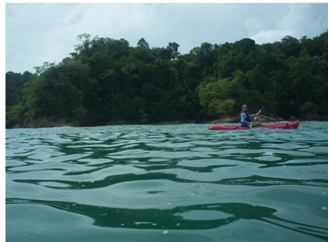
Havskajak är ett bra sätt att se nationalparkerna längs kusterna.