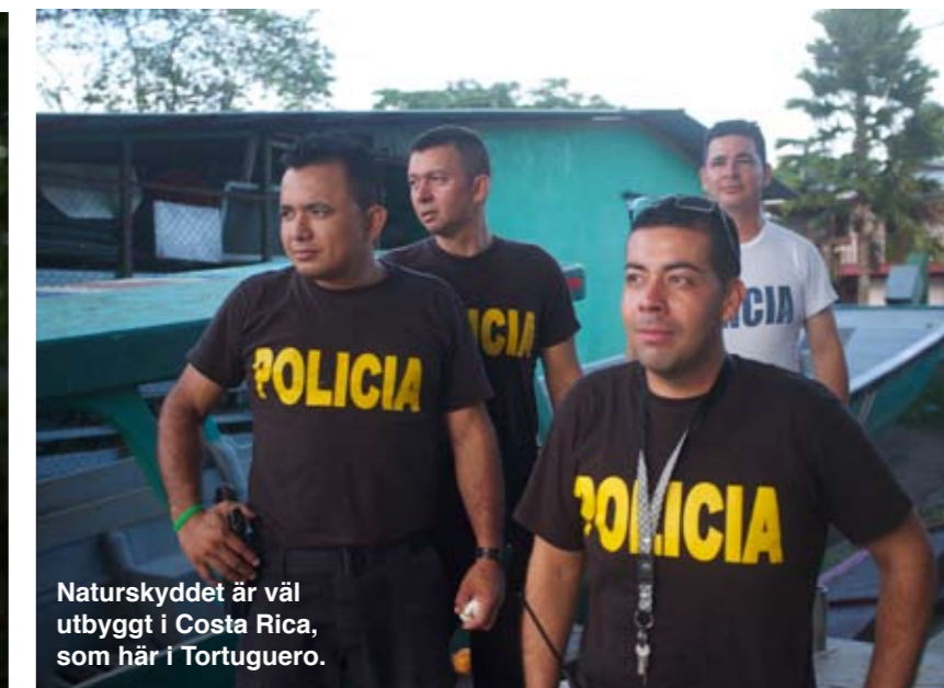
Naturskyddet är väl utbyggt i Costa Rica, som här i Tortuguero.