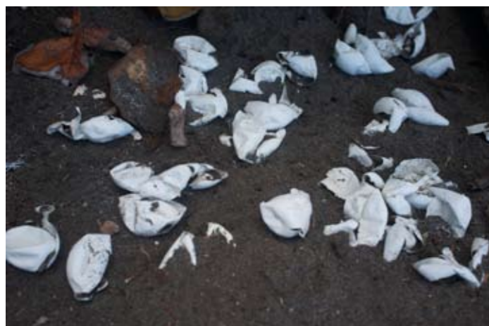
På stranden syns spåren av nykläckta sköldpaddungar.