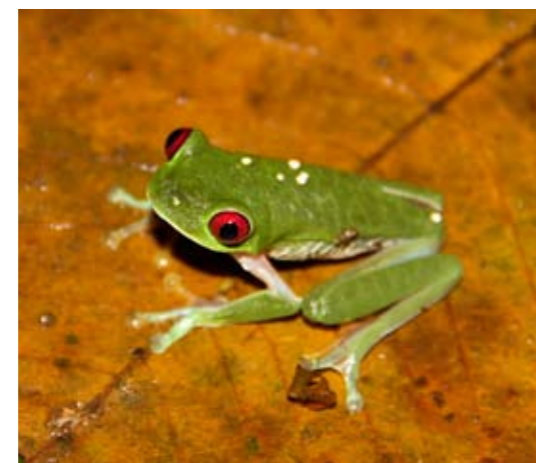
Rödögd trädgroda är aktiv på natten.