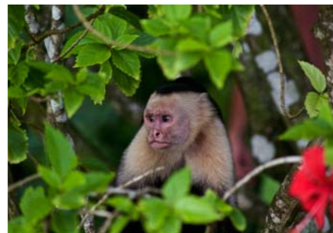
Capuchinapan kallas även "skogens bandit".