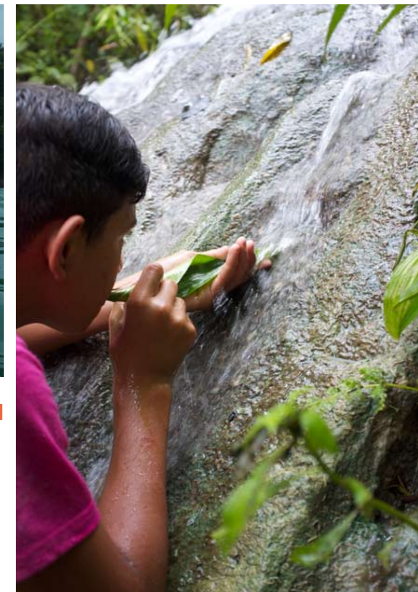
Ett vattenfall i regnskogen släcker snabbt törsten.

– Tidigare var det fullt med skulor här. Nu har det byggts avloppssystem och