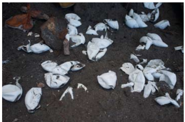
På stranden syns spåren av nykläckta sköldpaddungar.