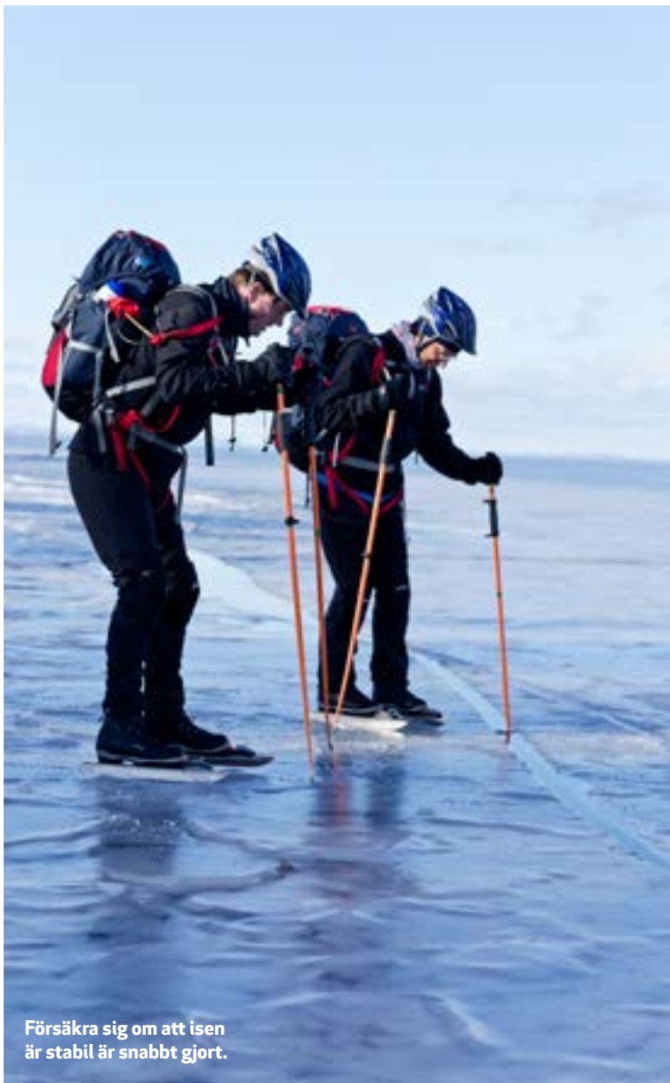
Försäkra sig om att isen är stabil är snabbt gjort.