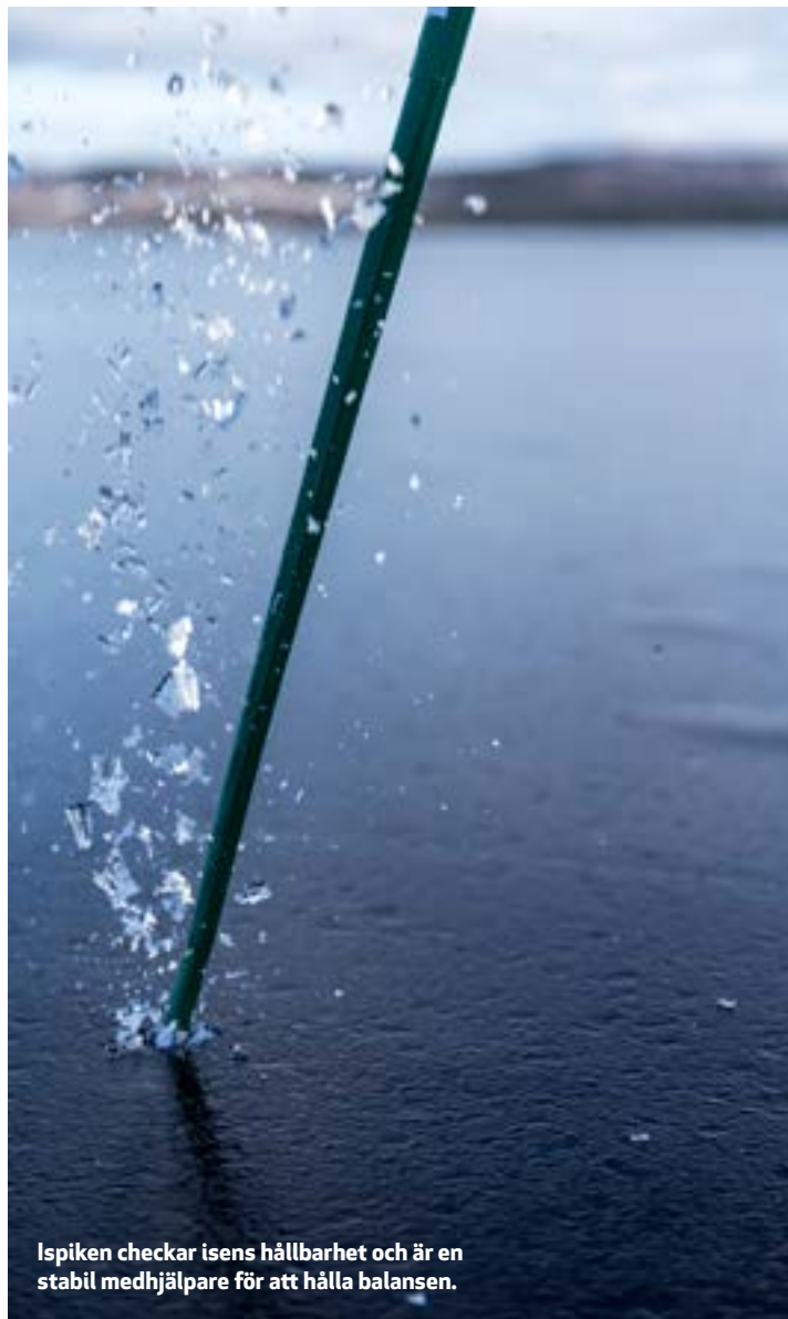
Ispiken checkar isens hållbarhet och är en stabil medhjälpare för att hålla balansen.

sjöar kring Steenwijkerwold i den norra delen av landet där de kommer från, och ofta besöker isar i både Italien och Österrike, ville de komma hit sedan de sett Youtube-filmer som grannarna lagt upp från Sverige.