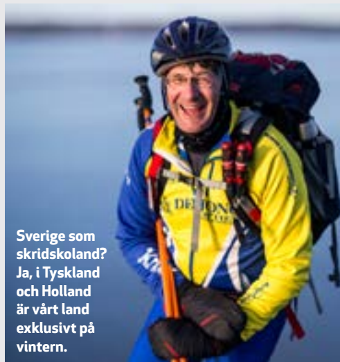
Sverige som skridskoland? Ja, i Tyskland och Holland är vårt land exklusivt på vintern.

Iceguide, iceguide.se , har som ambition att öka antalet deltagare genom större marknadsföring.