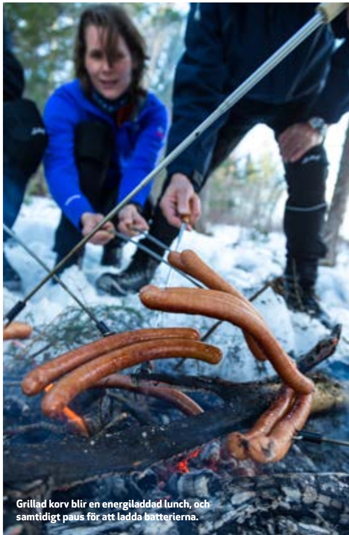
Grillad korv blir en energiladdad lunch, och samtidigt paus för att ladda batterierna.