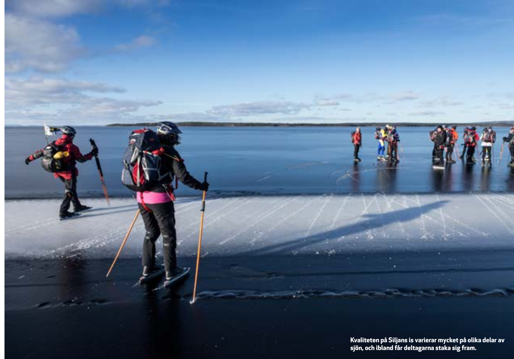
Kvaliteten på Siljans is varierar mycket på olika delar av sjön, och ibland får deltagarna staka sig fram.