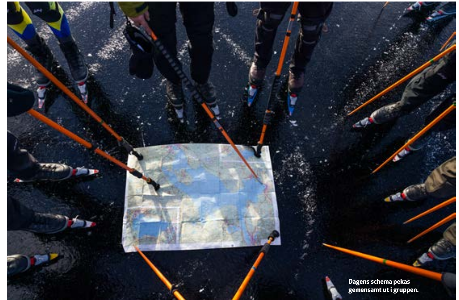
Dagens schema pekas gemensamt ut i gruppen.