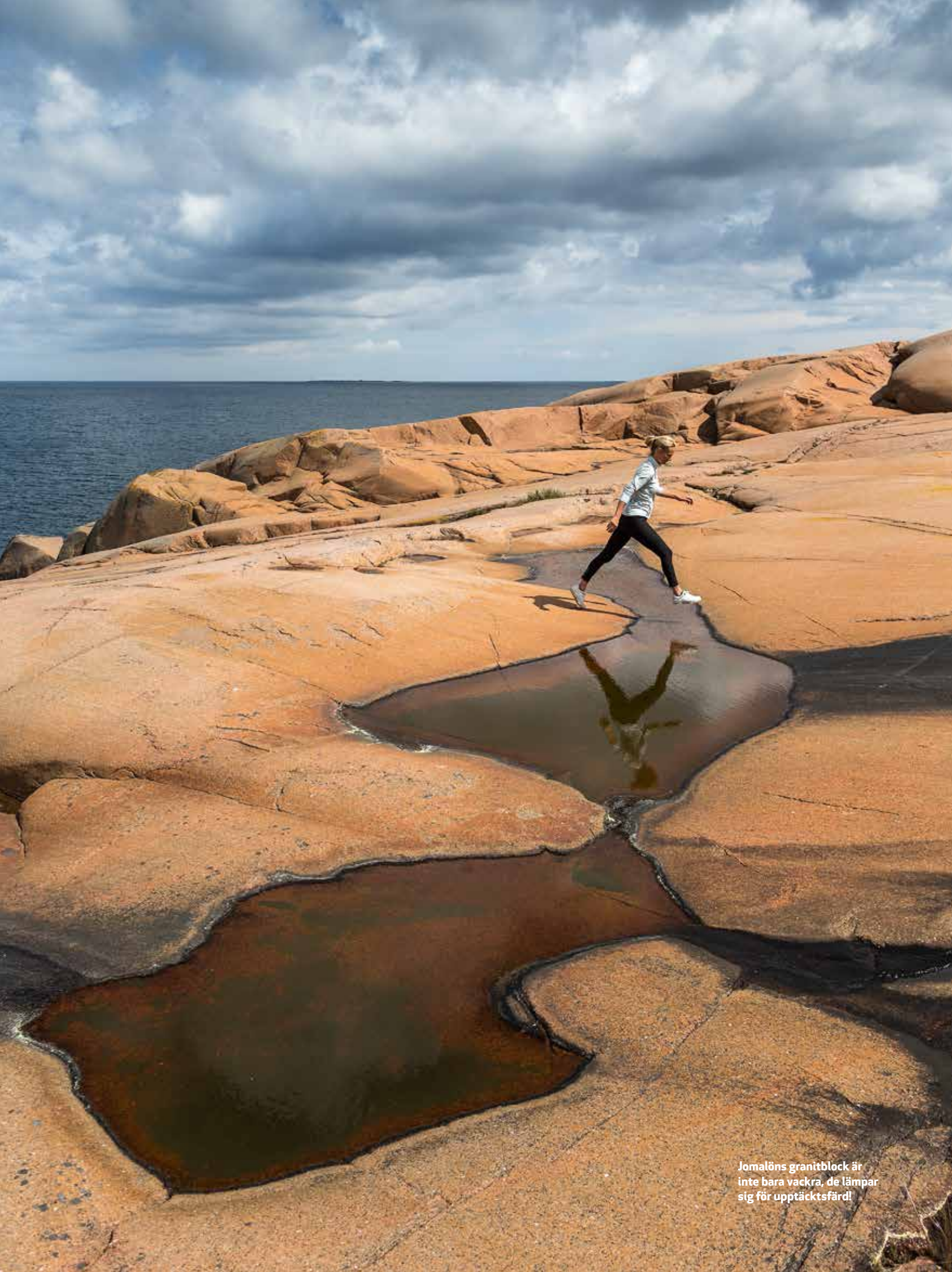
Jomalöns granitblock är inte bara vackra, de lämpar sig för upptäcktsfärd!