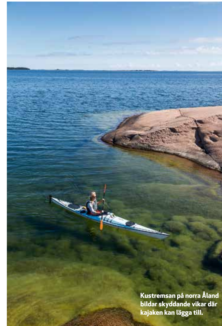
Kustremsan på norra Åland bildar skyddande vikar där kajaken kan lägga till.