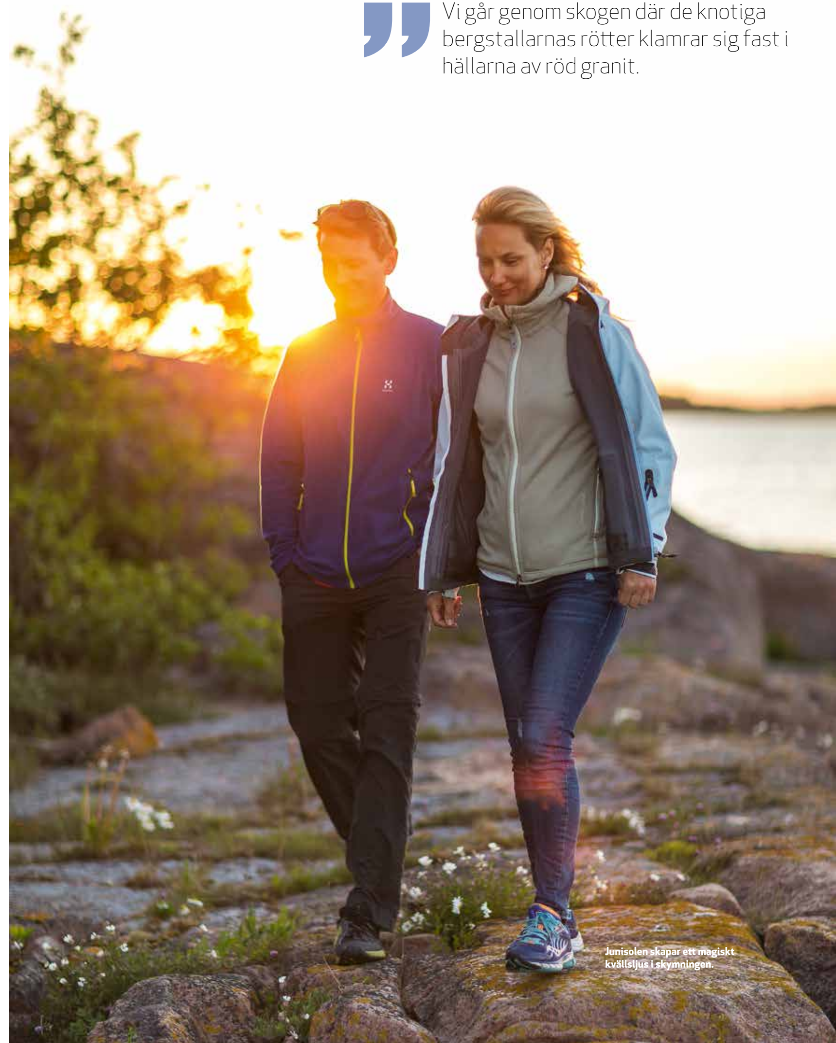
Junisolen skapar ett magiskt kvällsljus i skymningen.

Vi går genom skogen där de knotiga bergstallarnas rötter klamrar sig fast i hållarna av röd granit.