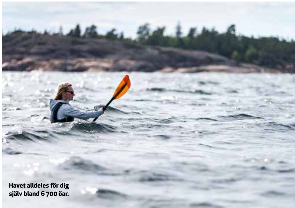
Havet alldeles för dig själv bland 6 700 öar.