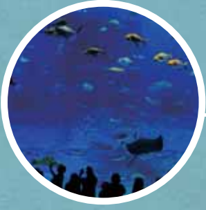
Okinawa Churaumi Akvaryumu Okinawa Churaumi Aquarium