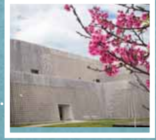
Koza Spor Parkı Koza Sports Park