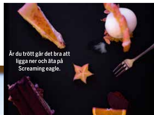
Är du trött går det bra att ligga ner och äta på Screaming eagle.