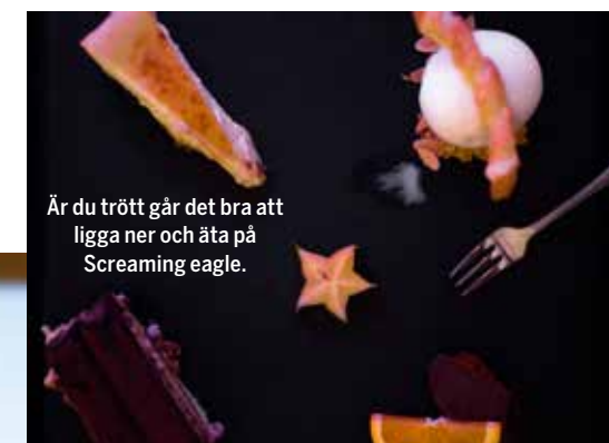
Är du trött går det bra att ligga ner och äta på Screaming eagle.

Här sitter vi ner och äter, eller ligger ner, det går bra det med. Restaurangen har