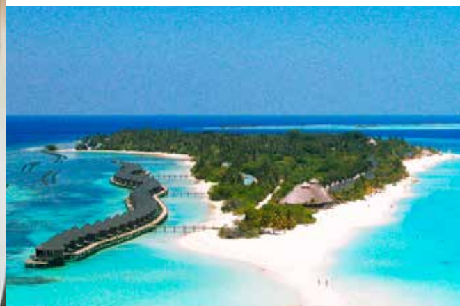
Ovan: På ön Kuredu finns landets största dykcenter.