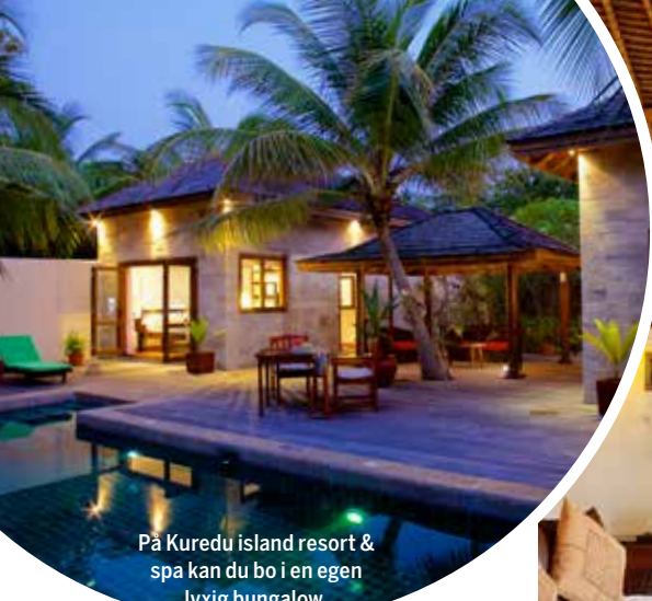
På Kuredu island resort & spa kan du bo i en egen lyxig bungalow.