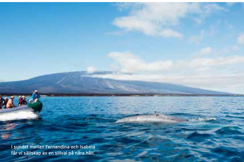
I sundet mellan Fernandina och Isabela får vi sällskap av en sillval på nära håll.