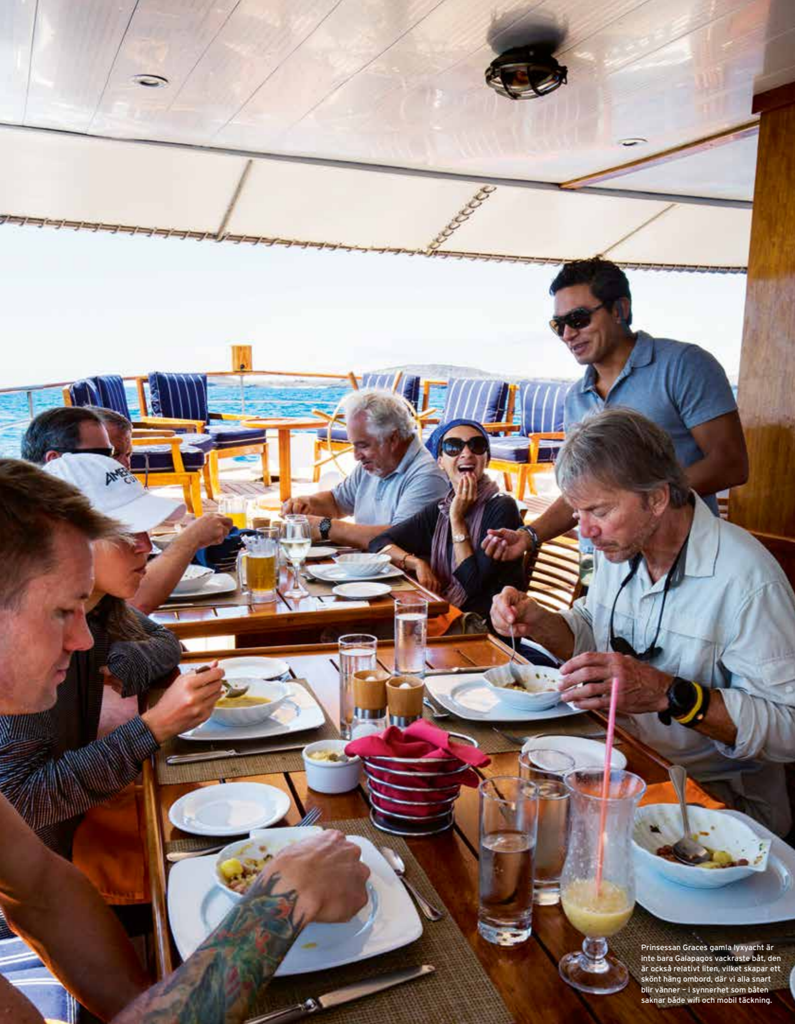
Prinsessan Graces gamla lyxyacht är inte bara Galapagos vackraste båt, den är också relativt liten, vilket skapar ett skönt häng ombord, där vi alla snart blir vänner – i synnerhet som båten saknar både wifi och mobil täckning.