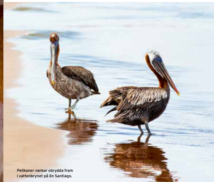
Pelikaner vankar obrydda fram i vattenbrynet på ön Santiago.