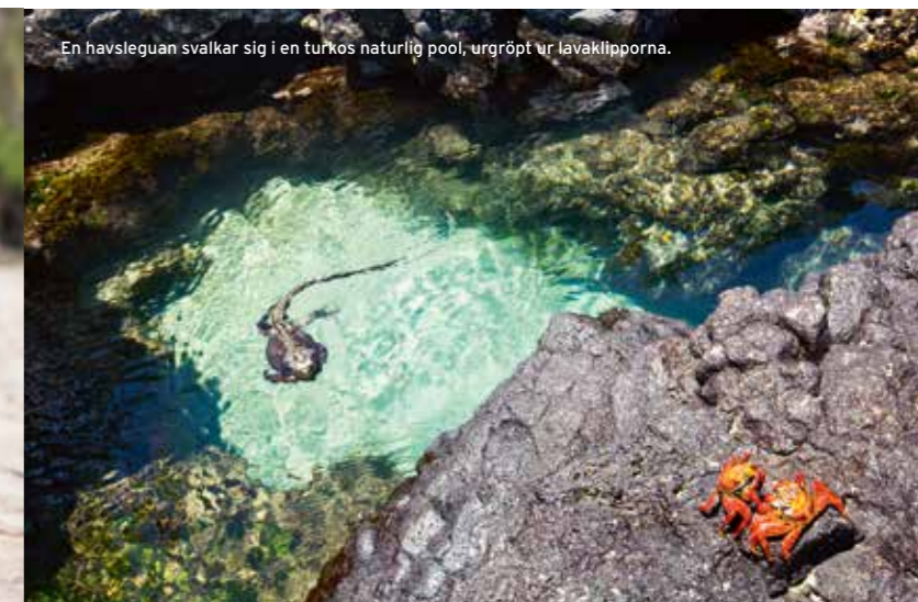
En havsleguan svalkar sig i en turkos naturlig pool, urgröpt ur lavaklipporna.