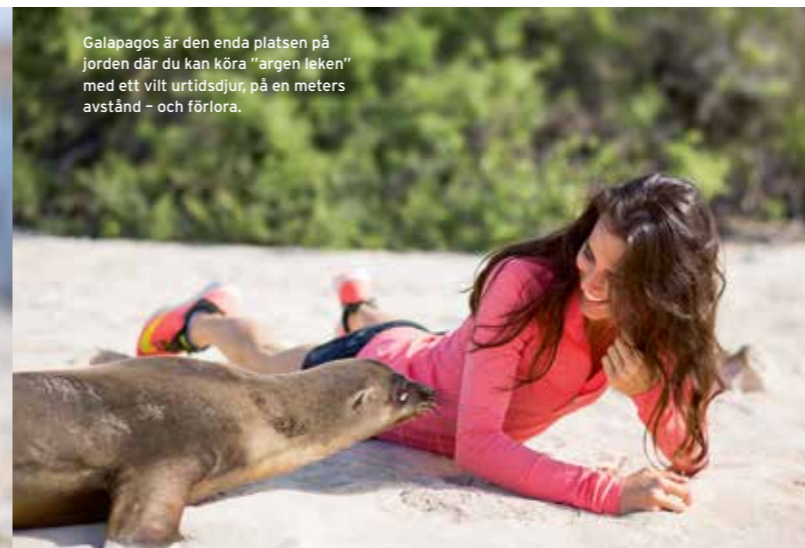
Galapagos är den enda platsen på jorden där du kan köra "argen leken" med ett vilt urtidsdjur, på en meters avstånd - och förlora.