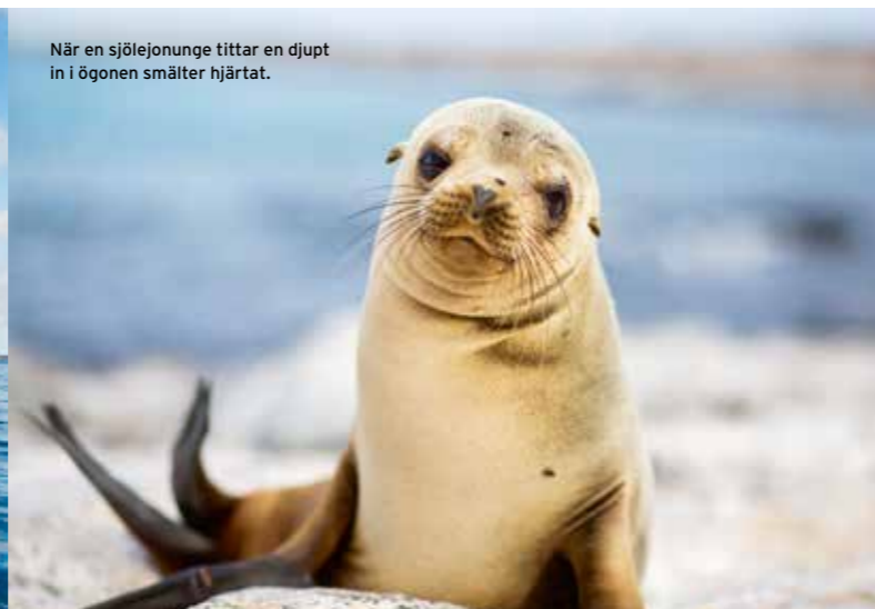
När en sjölejonunge tittar en djupt in i ögonen smälter hjärtat.