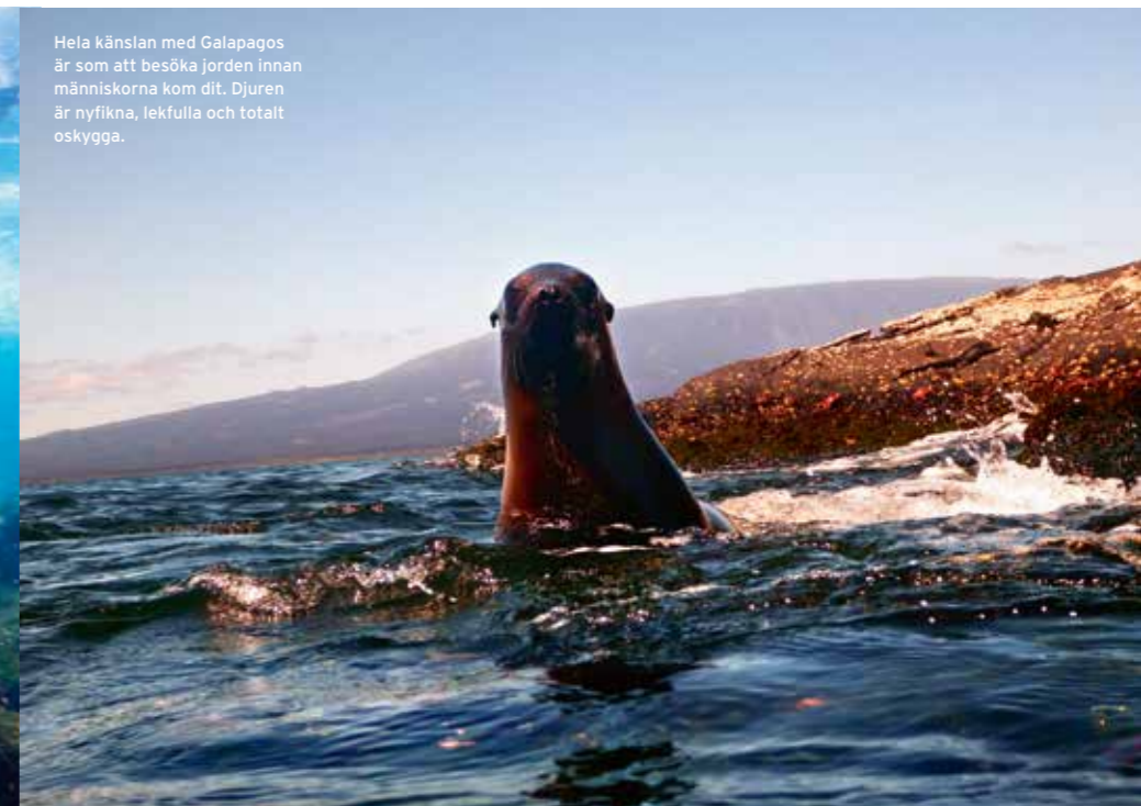
Hela känslan med Galapagos är som att besöka jorden innan människorna kom dit. Djuren är nyfikna, lekfulla och totalt oskygga.

G ummibåten glider in till strandkanten och vi hoppar ner i det kalla vattnet och vadar iland den sista biten. Bland Galapagos öar har Espumilla Beach det största antalet gröna havssköldpaddor som kommer för att lägga sina ägg på den långa sandstranden. Inga sköldpaddor syns till, däremot är stranden genomborrad av spökrabbor som grävt hål och patrullerar sin strandremsa. I luften flyger endemiska Galapagoshökar, som bara finns här, i jakt på fåglar och unga havsleguaner. En hök har hamnat i dispyt med en häger över en död fisk i strandkanten.