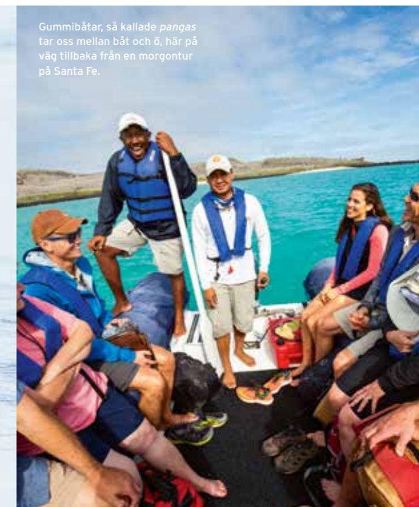
Gummibåtar, så kallade pangas tar oss mellan båt och ö, här på väg tillbaka från en morgontur på Santa Fe.