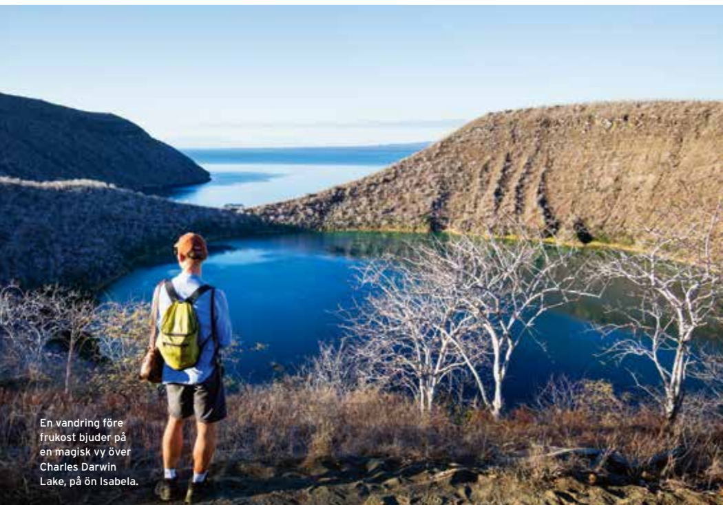
En vandring före frukost bjuder på en magisk vy över Charles Darwin Lake, på ön Isabela.