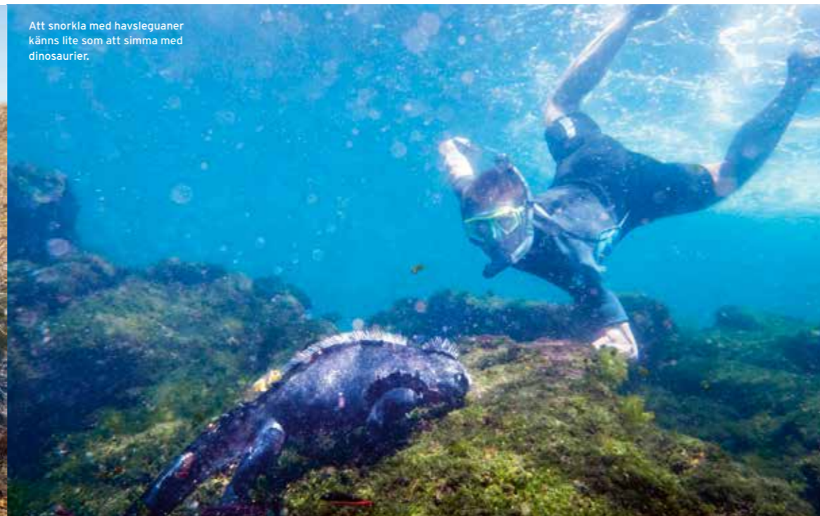
Att snorkla med havsleguaner känns lite som att simma med dinosaurier.