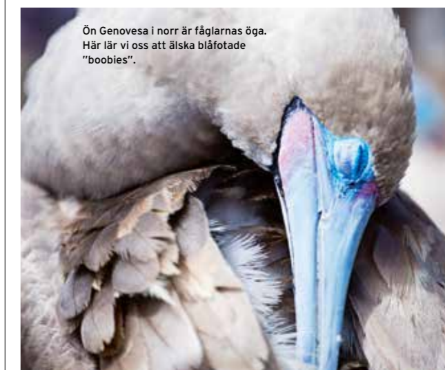
Ön Genovesa i norr är fåglarnas öga. Här lär vi oss att älska blåfotade "boobies".

Snorklingen och dykningen är varierad, vattentemperaturen ligger mellan 14 och 25 grader.