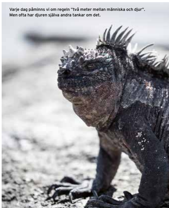
Varje dag påminns vi om regeln "två meter mellan människa och djur". Men ofta har djuren själva andra tankar om det.

Närvaron är total på M/Y Grace, mycket tack vare att både telefonnät och wifi saknas. Att vara uppkopplad verkade oroa några av deltagarna i början av resan, men efter några dagar har känslan istället förbytts till en anledning till att umgås och ta in omgivningarna ytterligare. Mörkret intar Galapagos och Stilla havet. Himlavalvet, där stjärnorna lyser utan någon tillstymmelse till ljusföroreningar, breder ut sig ovanför våra huvuden. ■