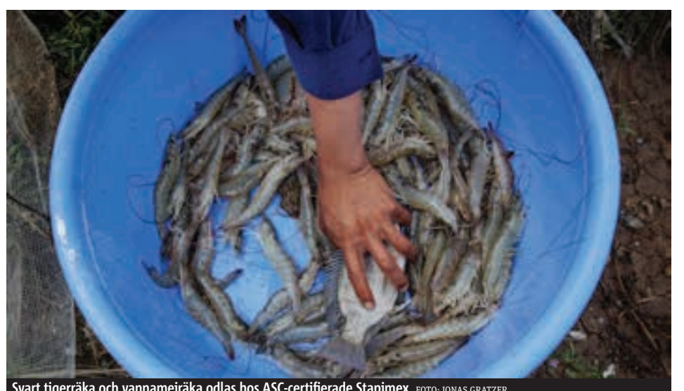
Svart tigerräka och vannameiräka odlas hos ASC-certifierade Stapimex.