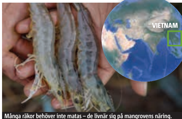
Många räkor behöver inte matas – de livnär sig på mangrovens näring.

Mangrove är naturliga barriärer mot vågor och stormar. En huvudorsak till att tsunamin i Indiska oceanen 2004 blev så allvarlig var att mycket av den skyddande mangroven var borta. När skogen huggs ner ökar