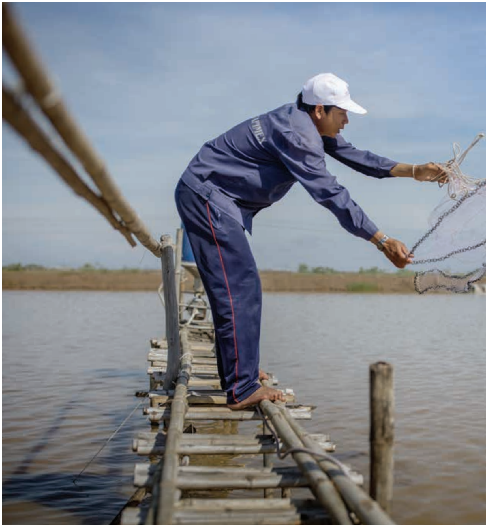
I den första delen i serien om fisk- och skaldjurens produktionsvillkor i Vietnam gör Metro ett nedslag i Mekongdeltat, där mangrove-skog skövlas för att bereda plats för räkodlingar som jobbar mer

Exemplen på hedersförtryck är många – men nu väntas Jordanien reformera lagen som ger sexbrottslingar amnesti. Ett parlamentsmöte är inplanerat. Det kungadömet väntas fatta beslut om är att skrota den lag som ger våldtäktsmän möjlighet att slippa straff genom att gifta sig med offret. TT