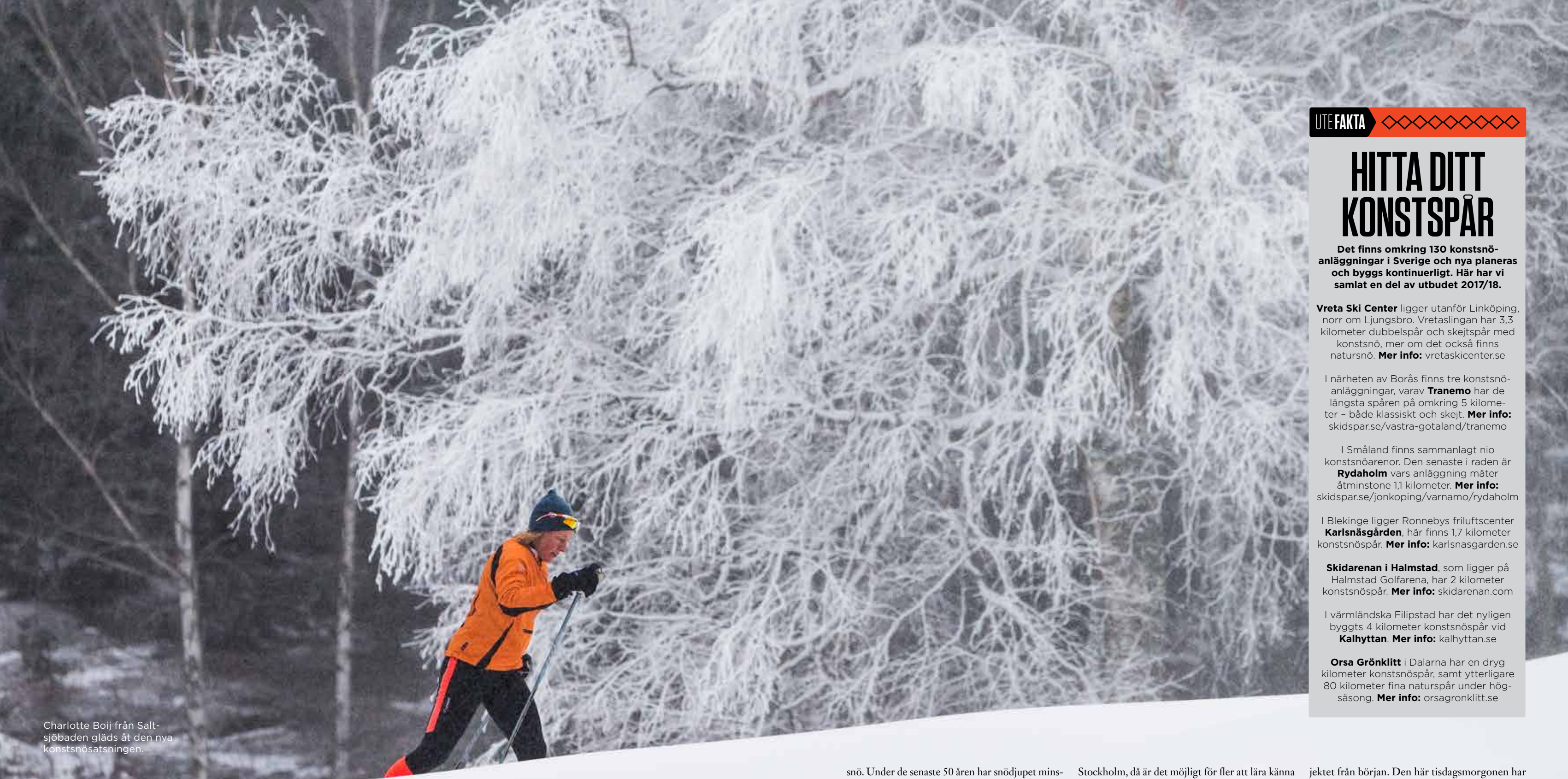
Charlotte Boij från Saltsjöbaden gläds åt den nya konstsnösatsningen.

B jörkarnas grenar tyngs av nyfallen pudersnö. Vintersolen står lågt, men en och annan stråle lyckas tränga sig igenom den grå januarihimlen. De två parallella spåren runt Saltsjöbadens Golfklubb är preparerade men bitvis isiga; slingan är 1,2 kilometer lång och det krävs några varv för att få ihop till ett vettigt träningspass. Klockan närmar sig nio på morgonen och några åkare gör sig redo att dra iväg.