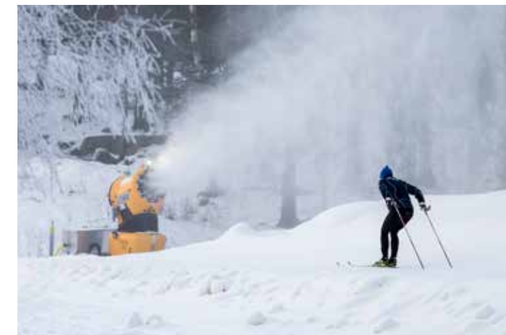
Klimatet blir allt varmare, snökanonerna allt fler ...