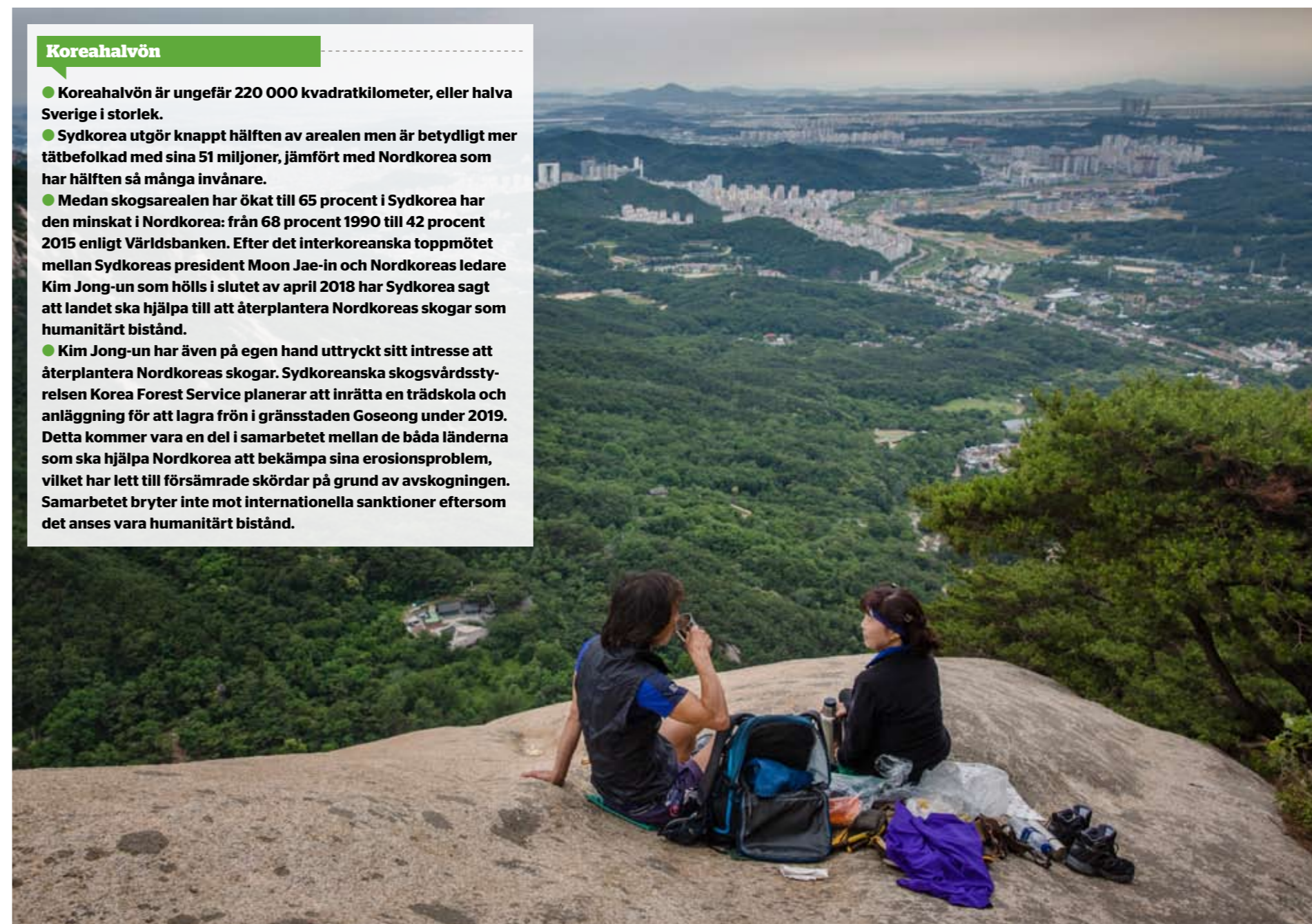
Skogarna bildar ett en grön matta över kullarna som omger Seoul. Sydkoreaner spenderar mycket tid i naturen, och att vandra i bergen ovanför Seoul är populärt.