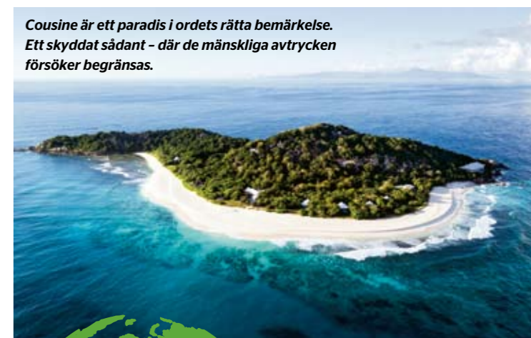
Cousine är ett paradiset i ordets rätta bemärkelse. Ett skyddat sådant – där de mänskliga avtrycken försöker begränsas.

DETTA ÄR EN BERÄTTELSE FINANSIERAD VIA FOLKETS PRESSTÖD SWISH 123 508 75 49 ELLER BG 675-0855 ELLER ANVÄND KORT PÅ ETC.SE