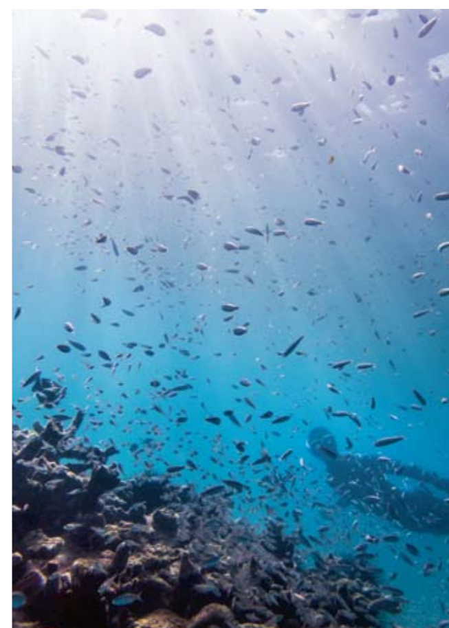
Korallerna utanför ön Félicité blektes i senaste El Niño men har nu börjat återplanteras.