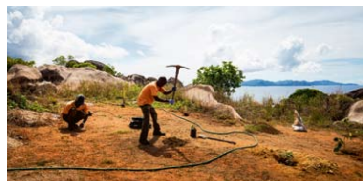
Återplantering av den ursprungliga skogen pågår på många av öarna. Här planteras nya träd på Félicité.

● Cirka 350 000 turister besökte Seychellerna under 2018 och turistintäkterna uppgick till drygt 4,5 miljarder kronor. Det motsvarar en 15-procentig ökning i intäkter från året innan. Antalet turister ökade under 2018 med tre procent.