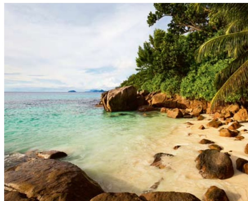
Petite Anse, som betyder Lilla stranden, är en av huvudön Mahés finaste stränder.