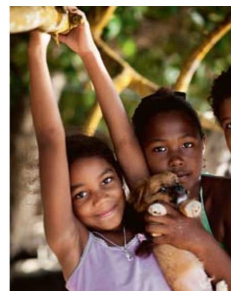
Seychellernas barn är framtiden – därför satsar landet på utbildning i hållbarhet.

och Seychellerna är inget undantag. Efter den senaste El Nino, som är ett återkommande klimattänomen i Indiska oceanen och Stilla havet, för två år sedan blektes stora delar av ögruppen rev. Trots att öar som Cousine och Félicité har börjat återplantera sina korallrev är det en svår kamp så länge jordens uppvärmning pågår.