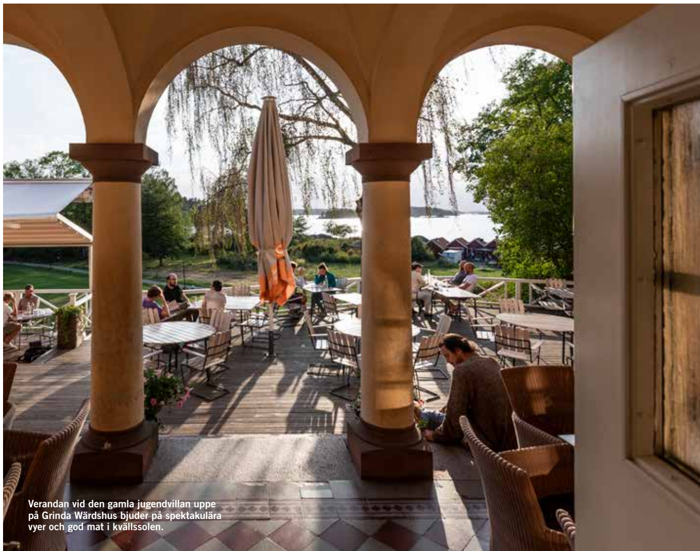
Verandan vid den gamla jugendvillan uppe på Grinda Wårdshus bjuder på spektakulära vyer och god mat i kvällssolen.

» Han sitter med vid bordet, blickar ut över hamnen nedanför, och ser nöjd ut.