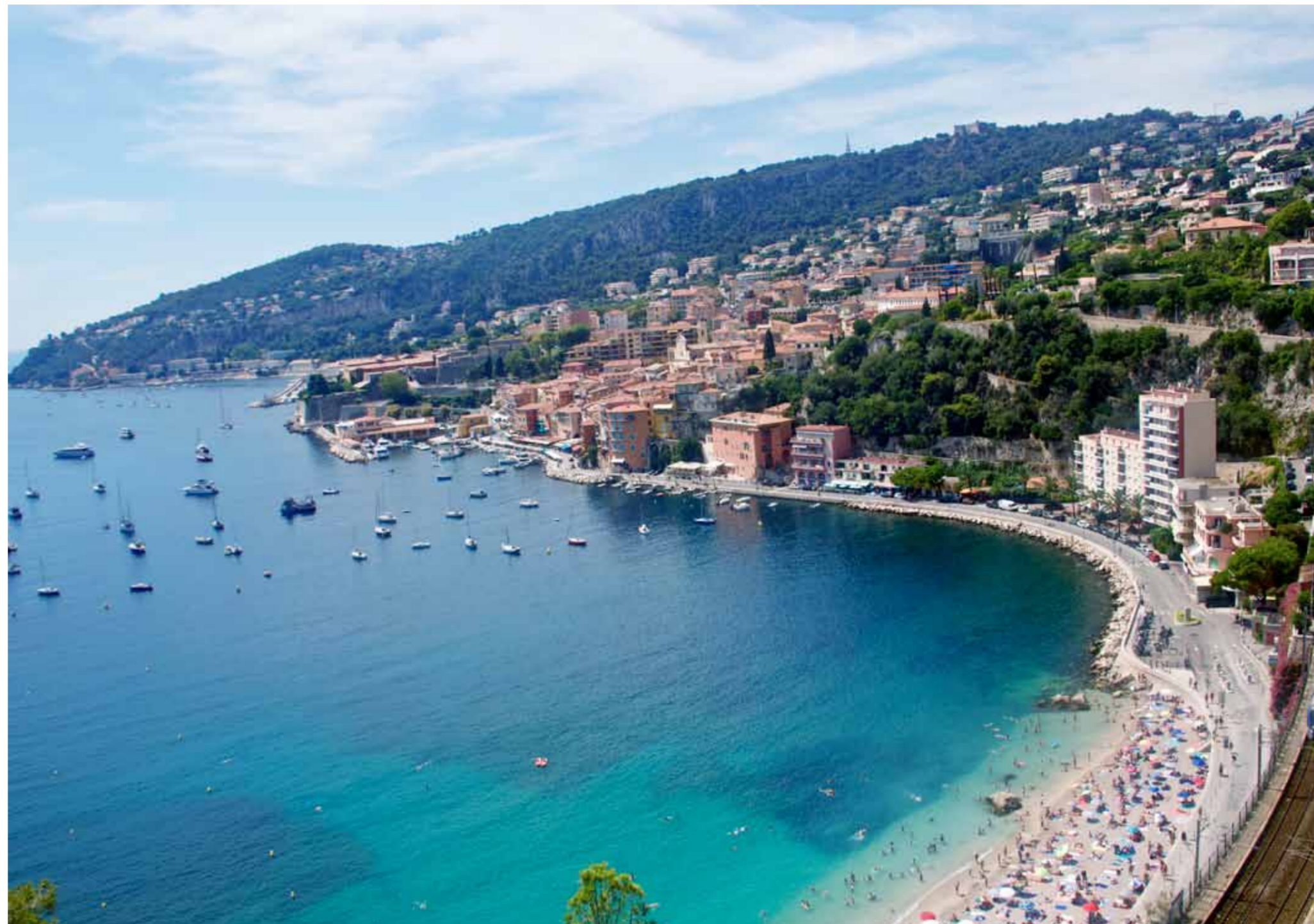
■ Från Nice kan man cykla både åt öst och väst, men den som inte tycker om höjdskillnader bör sikta västerut.

co. Den första sträckan genom hamnen i Nice är platt och imponerar med färgsprakande arkitektur. Snart börjar kullarna och uppförbackarna, och fokus flyttas från omgivningarna till asfalten under cykeldäcken. Det är ungefär lunchtid, solen står i zenit med en värme som ligger en bra bit över 30-strecket, och svetten rinner över min bara överkropp.