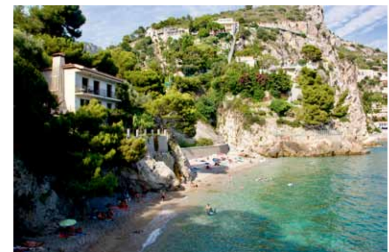
■ Stigen ner till Eze Beach liknar ett tropiskt badparadis, och nere vid havet rullar små vågor in över de småstenar som bildar stranden.