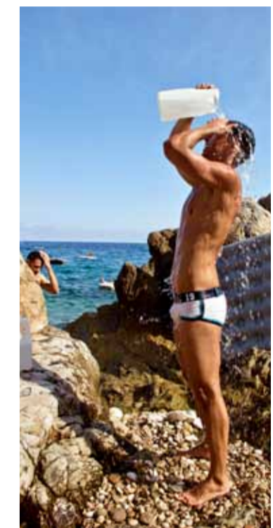
■ Eze Beach är huvudsakligen en gaystrand för män.

● Buss 100 går regelbundet mot Monaco från hamnen i Nice och stannar vid Eze Beach och Mala Beach.