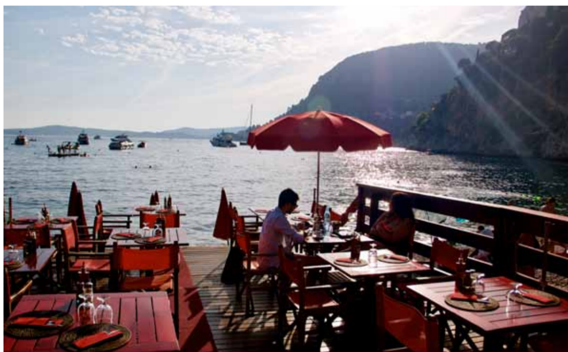
■ Mala Beach har någonting för alla, inklusive restauranger och barer precis vid vattnet.