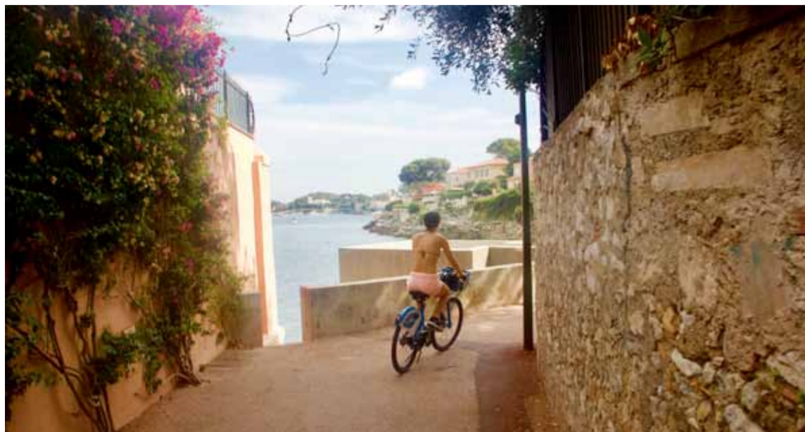
■ På halvön Saint-Jean-Cap-Ferrat följer vi smala passager längs avskilda gator tills cykelleden slingrar sig längs kusten och Promenade Maurice Rouvier.