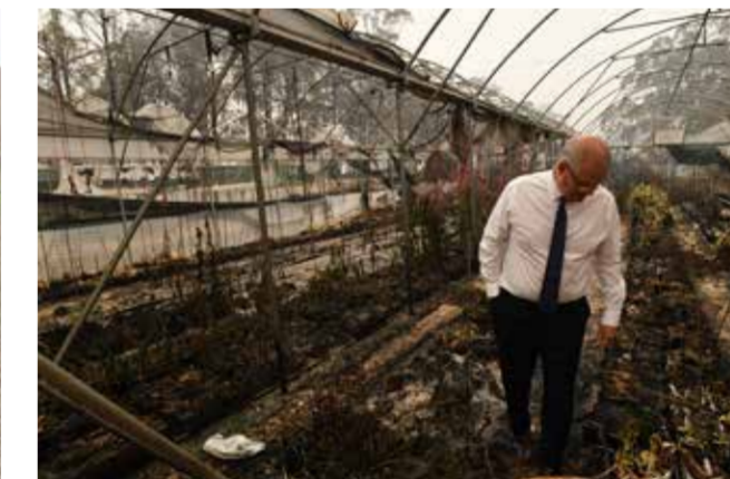
Premiärminister Scott Morrison har fått hård kritik för hur hans regering hanterat bränderna.

Premiärministern Scott Morrisons popularitet har dalat kraftigt på grund av regeringens hantering av bränderna. Enligt en färsk opinionsundersökning är 59 procent av befolkningen missnöjda med Morrison och oppositionspartiet Labors premiärministerkandidat Anthony Albanese har nu gått om Morrison.