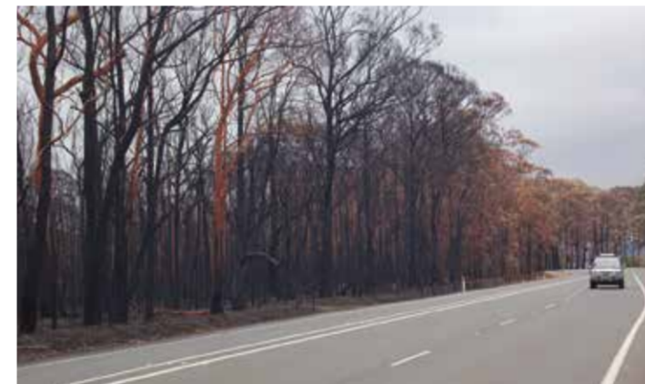
Skogen längs vägen i Blue Mountains är bränd.