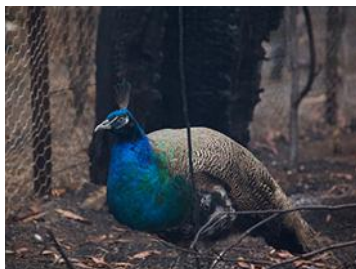
En förvirrad påfågel stryker runt de nedbrunna husen.

mer att agera starkare efter detta. Vi har hela världens ögon på oss, säger Sarah Keighery.