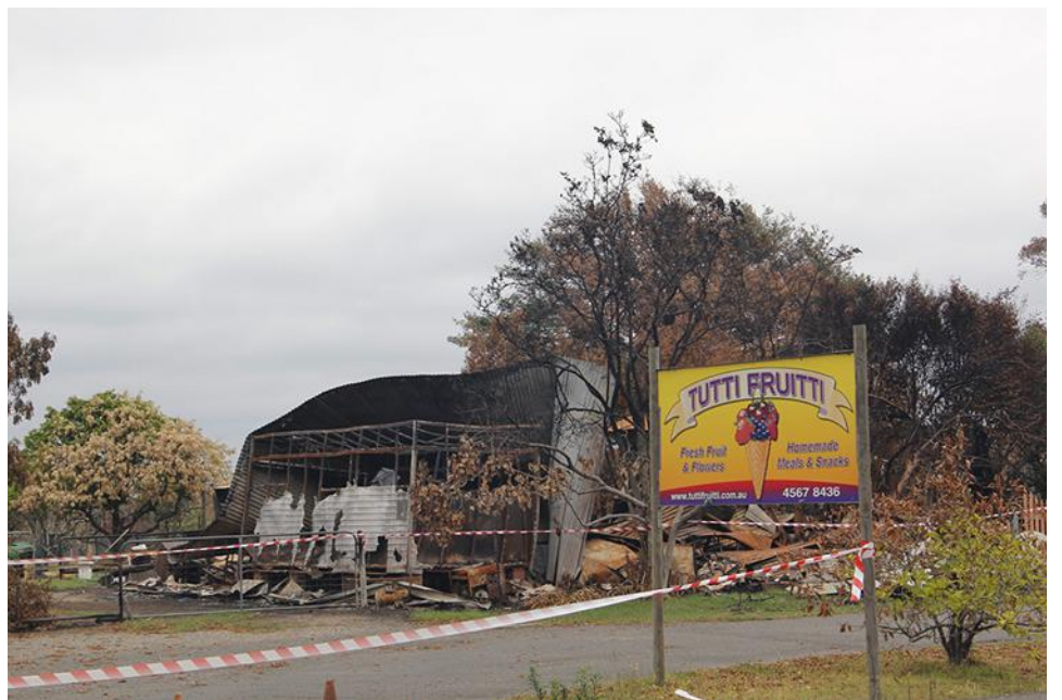
Rökluften hänger sig kvar och få besökare vågar sig till Bilpin.