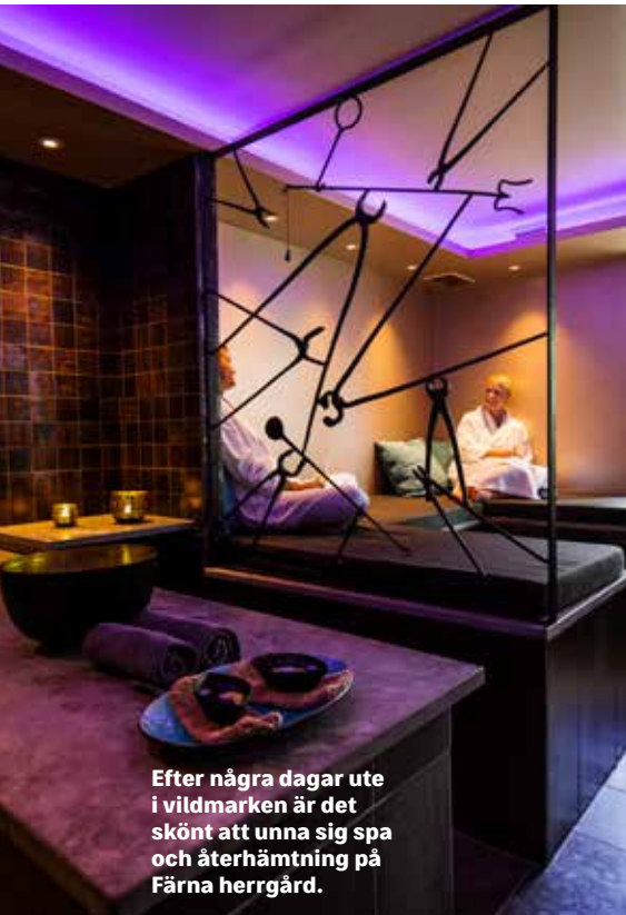
Efter några dagar ute i vildmarken är det skönt att unna sig spa och återhämtning på Färna herrgård.