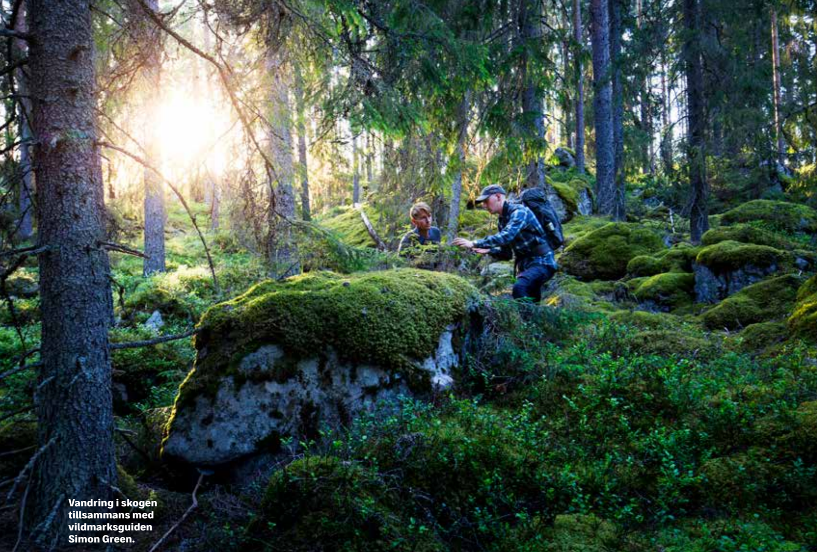
Vandring i skogen tillsammans med vildmarksguiden Simon Green.