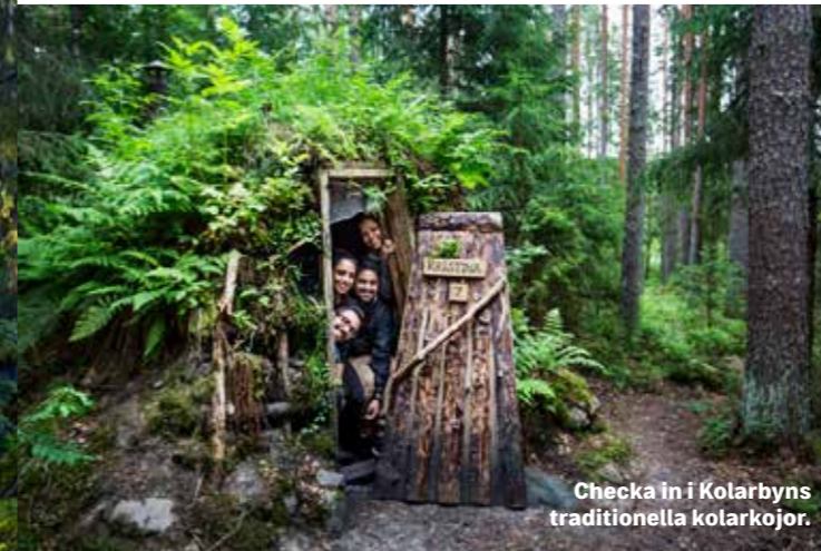
Checka in i Kolarbyns traditionella kolarkojor.