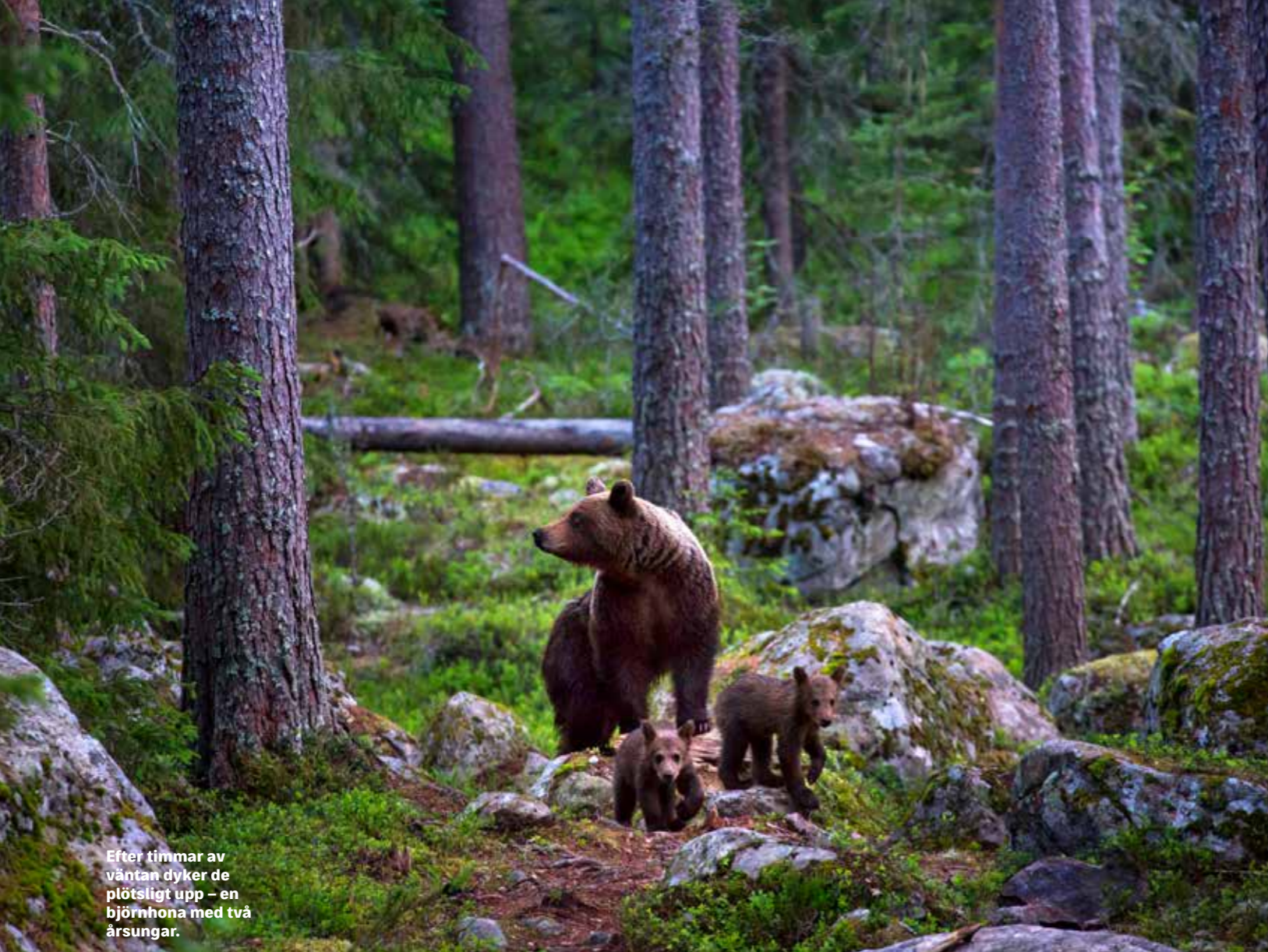
Efter timmar av väntan dyker de plötsligt upp – en björnhona med två årsungar.