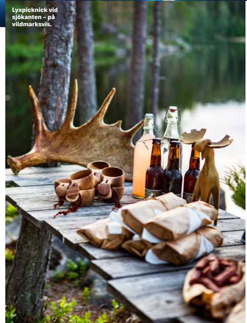
Lyxpicknick vid sjökanten – på vildmarksvis.