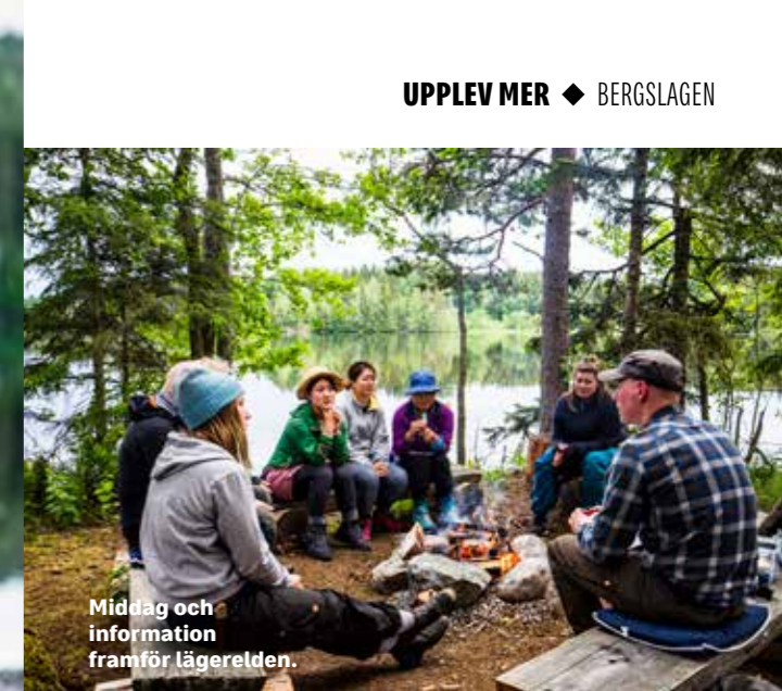
Middag och information framför lägerelden.