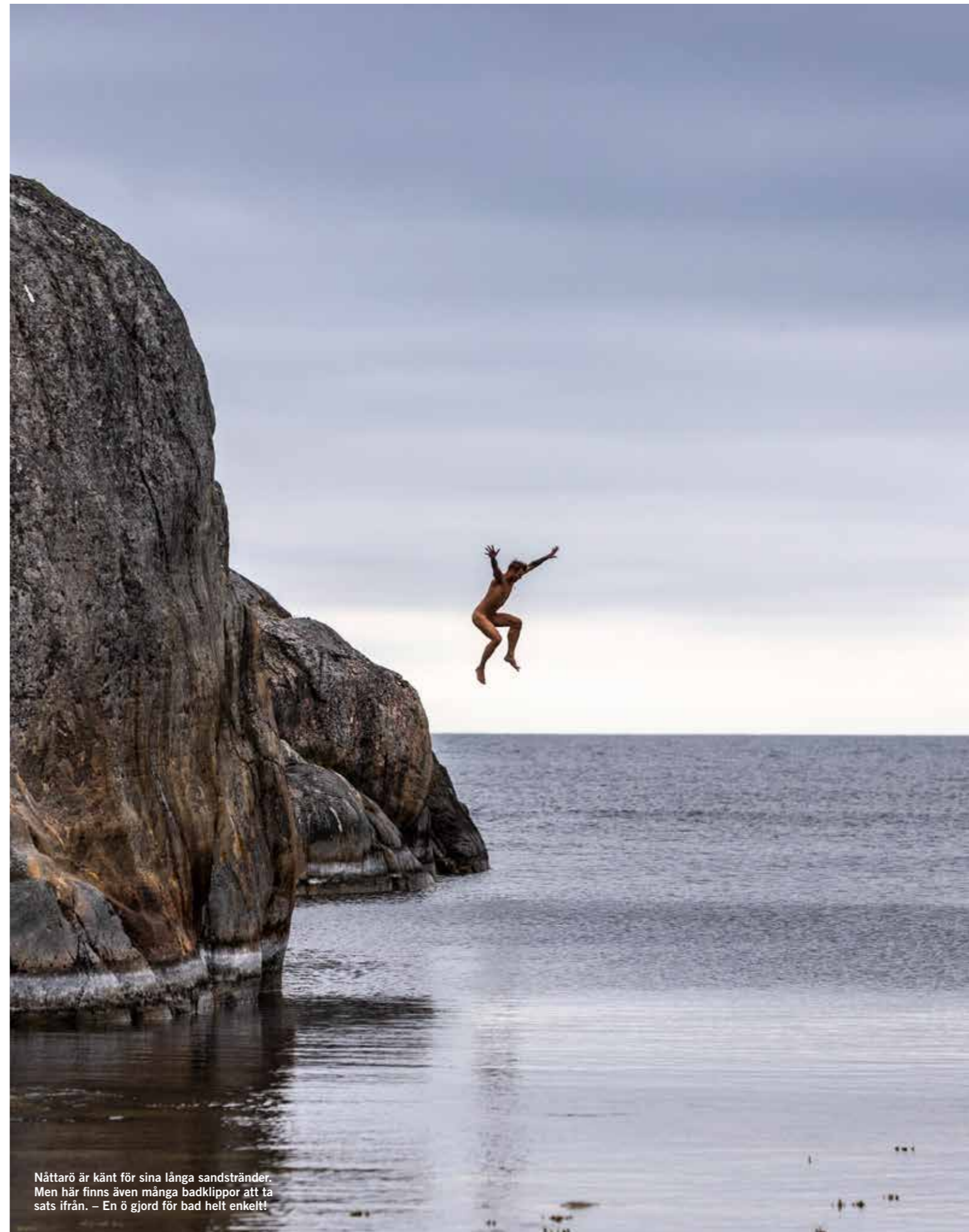
Nättarö är känt för sina långa sandstränder. Men här finns även många badklippor att ta sats ifrån. – En ö gjord för bad helt enkelt!

VI CYKLAR TILLBAKA på den sandiga stigen och stannar till vid Drottninggrottan som fått namnet efter drottning Maria Eleonora. Mossor hänger från de fuktiga väggarna i grottan, och ormbunkar slår spröt utanför. Luften i grottan känns som att den har blivit behandlad av naturliga luftfilter – och är skön att andas in. På väg tillbaka till öns andra sida passerar vi en öppen äng. Där betar en flock dovhjortar, som springer tillbaka in i skogen när de får syn på oss. Arten planterades in på Nättarö på 1950-talet; och ett hundratal hjortar