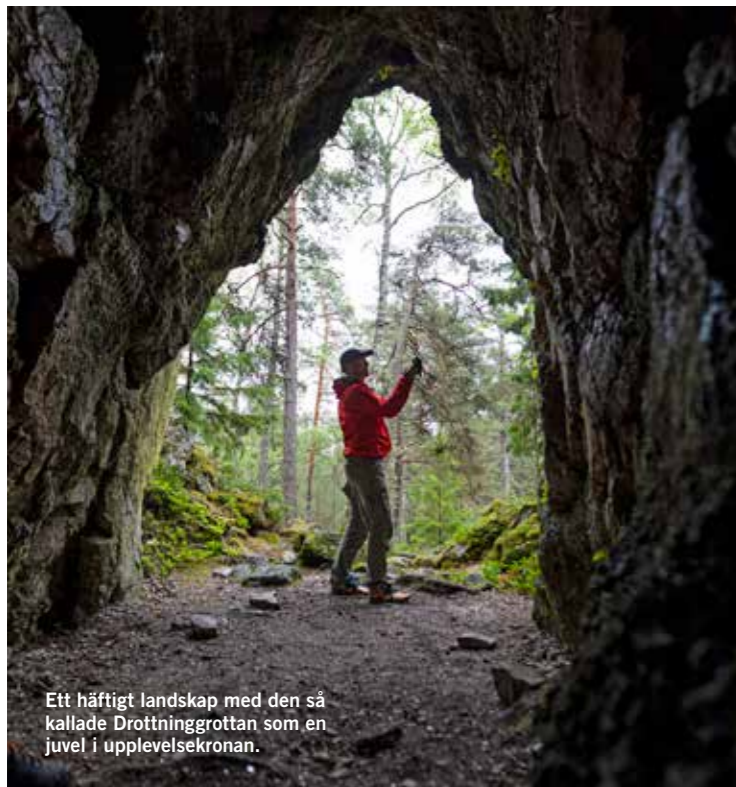
Ett häftigt landskap med den så kallade Drottninggrottan som en juvel i upplevelsekronan.