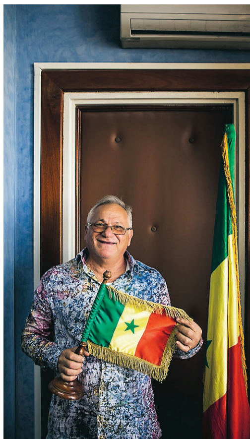
Fiskeministern Haidar El Ali i sitt arbetsrum på ministeriet i centrala Dakar.

– Det finns hajar inom regeringen som tjänar stora pengar på fiskelicenser, klargör Haidar.