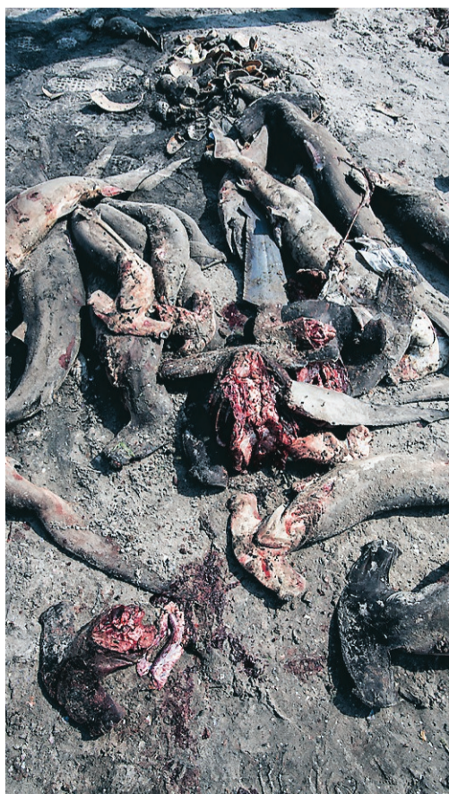
Slaktade hammarhajar i Kayars fiskeläger. Senegal är ett fattigt land, och en fiskelicens kostar 15 000 euro om året – med utbredd korruption som följd.