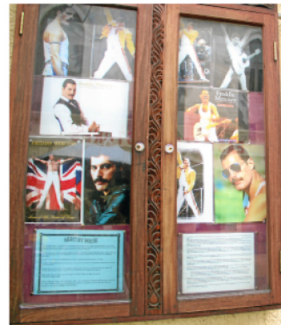
Den kanske största turistattraktionen är Mercury House - huset där sångaren Freddie Mercury växte upp.