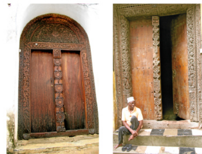
Portarna är en attraktion, de välvda har indiskt ursprung.