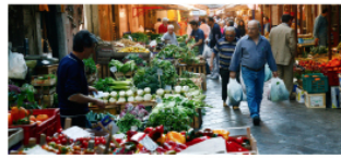
Catania's marknad.