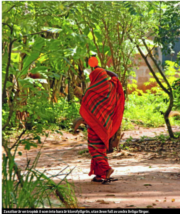
Zanzibar är en tropisk ö som inte bara är klorofyllgrön, utan även full av andra livliga färger.