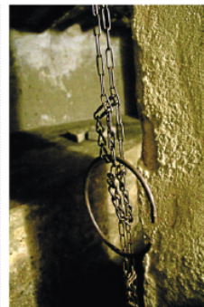
De forna slavkammarna har nu gjorts om till vandrarhem.

Trots att Stone town är Unesco-listat så skyddar det inte mot det tropiska monsunklimatet och misskötsel. Många dörrar är runt 150 år och trots att teak är ett tåligt material leder fukten till att träet ruttnar, och termiter spår i vissa fall på effekten ytterligare. I souvenirbu-