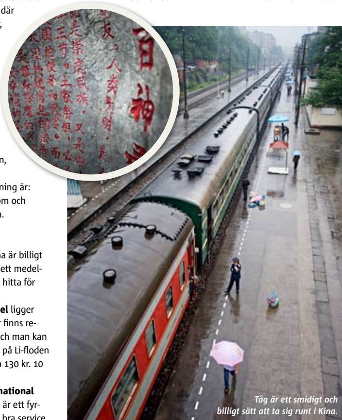
Tåg är ett smidigt och billigt sätt att ta sig runt i Kina.