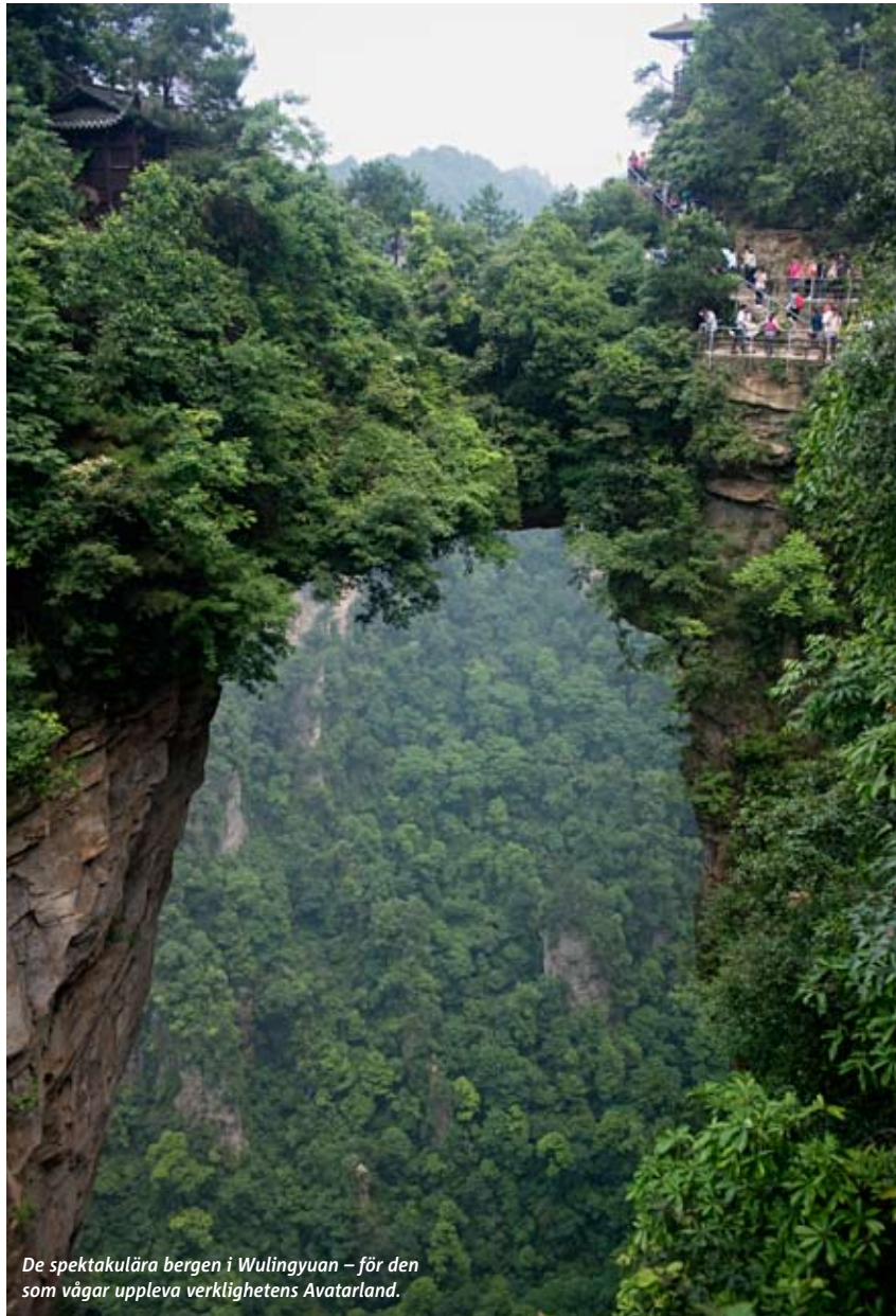
De spektakulära bergen i Wulingyuan – för den som vågar uppleva verklighetens Avatarland.

många har också börjat underhålla den växande skaran av turister som vill se hur det uråldriga fiskandet med skarvar går till.