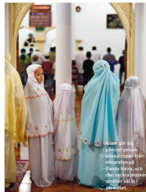
Islam gör sig påmind genom böneutropen från minaretten på Banda Neira, och den vackra moskén smälter väl in i paradiset.