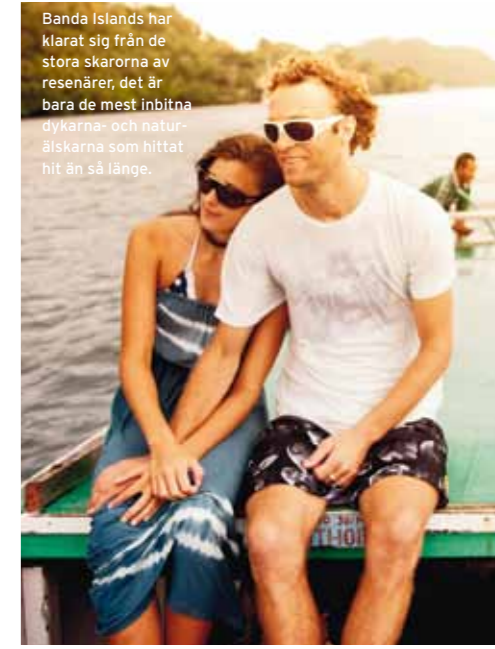
Banda Islands har klarat sig från de stora skarorna av resenärer, det är bara de mest inbitna dykarna- och naturälskarna som hittat hit än så länge.

”De gyllenbruna pannkakorna med muskotsylt är standardfrukost på Banda Islands – människor här är stolta över den historia och tradition som smeknamnet ’Spice Islands’ innebär.”