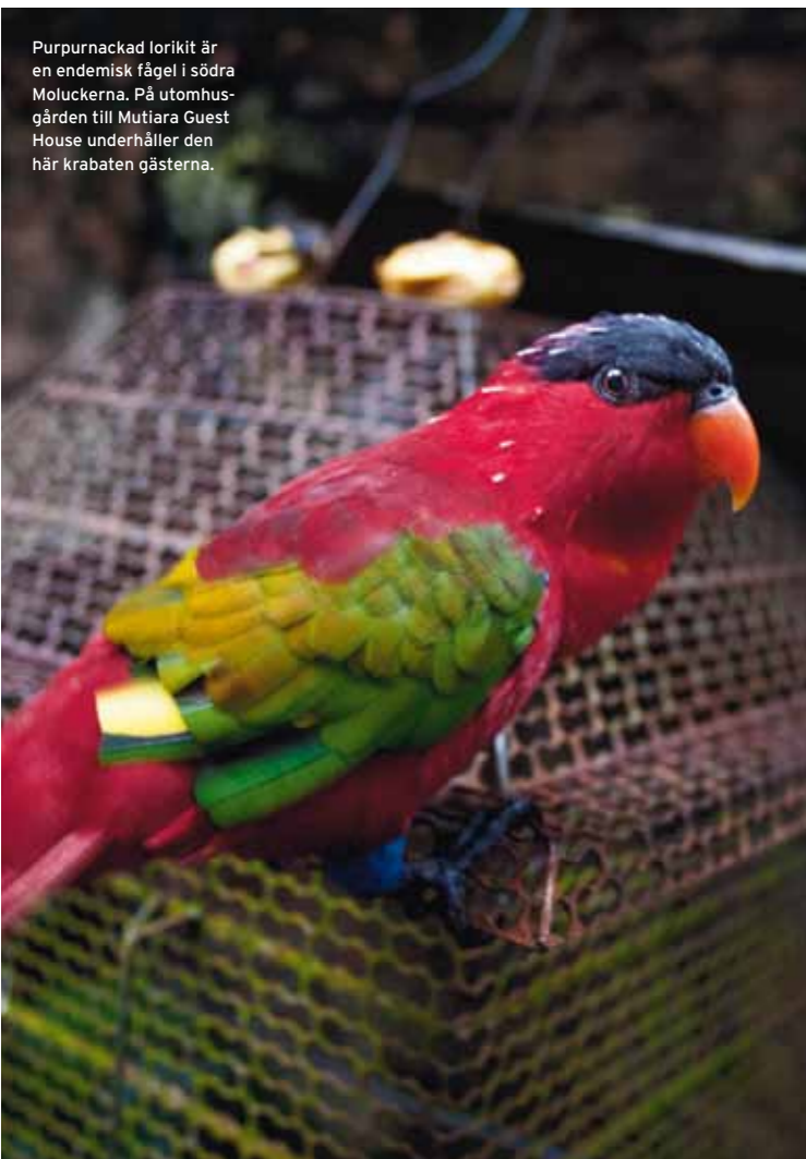
Purpurnackad lorikit är en endemisk fågel i södra Moluckerna. På utomhusgården till Mutiara Guest House underhåller den här krabaten gästerna.