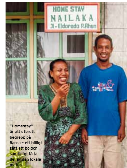
”Homestay” är ett utbrett begrepp på öarna – ett billigt sätt att bo och samtidigt få ta del av den lokala maten.