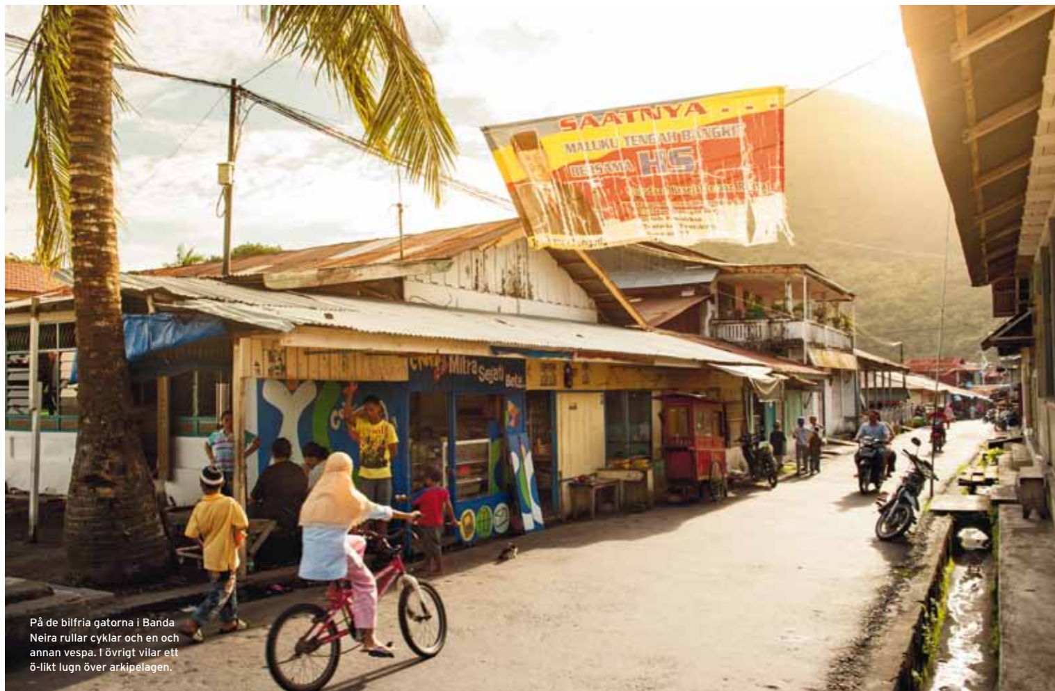
På de billiga gatorna i Banda Neira rullar cyklar och en och annan vespa. I övrigt vilar ett ö-likt lugn över arkipelagen.

”Modiga besökare med bra kondition tar lerstigen upp och nerför vulkanen – ett träningspass som varar några timmar.”