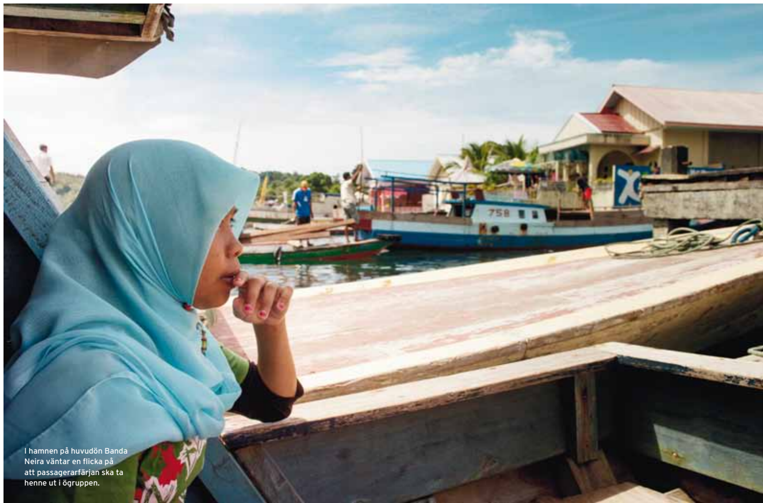
I hamnen på huvudön Banda Neira väntar en flicka på att passagerarfärjan ska ta henne ut i ögruppen.

F ärjan markerar sin ankomst till den lilla hamnen på Banda Neira med en hänsynslös signal i mistluren. Klockan är sex på morgonen och trots att solen ännu inte är uppe är det lönlöst att försöka sova vidare, eftersom färjan kommer att fortsätta tuta ända tills hon avgår mot Kota