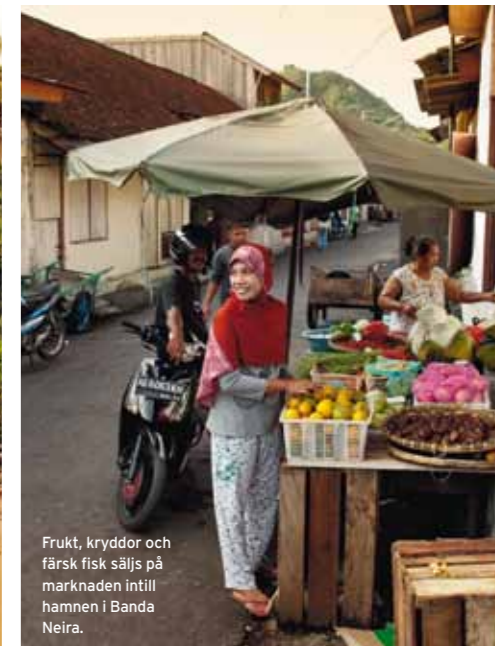
Frukt, kryddor och färsk fisk säljs på marknaden intill hamnen i Banda Neira.