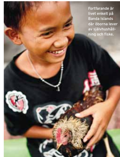
Fortfarande är livet enkelt på Banda Islands där öborna lever av självhushållning och fiske.

Hon avslutar meningen med ett leende och en axelryckning; kanske för att säga att livet är till för att njutas – inte för att oro sig över öarnas sophanteringsproblem. De gyllenbruna pannkakorna med muskotsylt är standardfrukosten på Banda Islands – människor här är stolta över den historia och tradition som smeknamnet ”Spice Islands” innebär. Sylten smakar som Coca-Cola – läskan sägs innehålla ett ämne som påminner om muskot. En syrlig, frisk kolainspirerad smak dominerar i gommen efter en pannkakstugga. Portugiserna kom hit redan i början på 1500-talet och holländarna i slutet av samma århundrade – båda teamen på jakt efter muskotnöt och andra värdefulla kryddor. I dag exporteras muskotnöten härifrån till stora delar