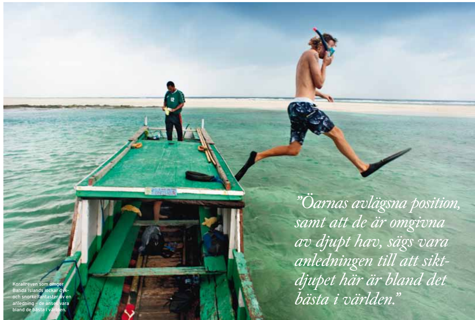
Korallreven som omger Banda Islands lockar dyk- och snorkelfantaster av en anledning – de anses vara bland de bästa i världen.

”Öarnas avlägsna position, samt att de är omgivna av djupt hav, sägs vara anledningen till att sikt-djupet här är bland det bästa i världen.”