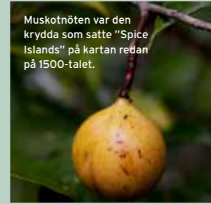
Muskotnöten var den krydda som satte "Spice Islands" på kartan redan på 1500-talet.