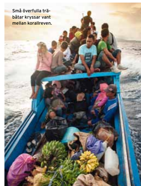
Små överfulla träbåtar kryssar vant mellan korallreven.

”De gyllenbruna pannkakorna med muskotsylt är standardfrukost på Banda Islands – människor här är stolta över den historia och tradition som smeknamnet ’Spice Islands’ innebär.”