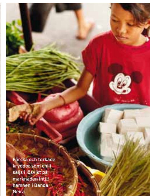
Färsk och torkade kryddor som chili säljs i lösvikt på marknaden intill hamnen i Banda Neira.