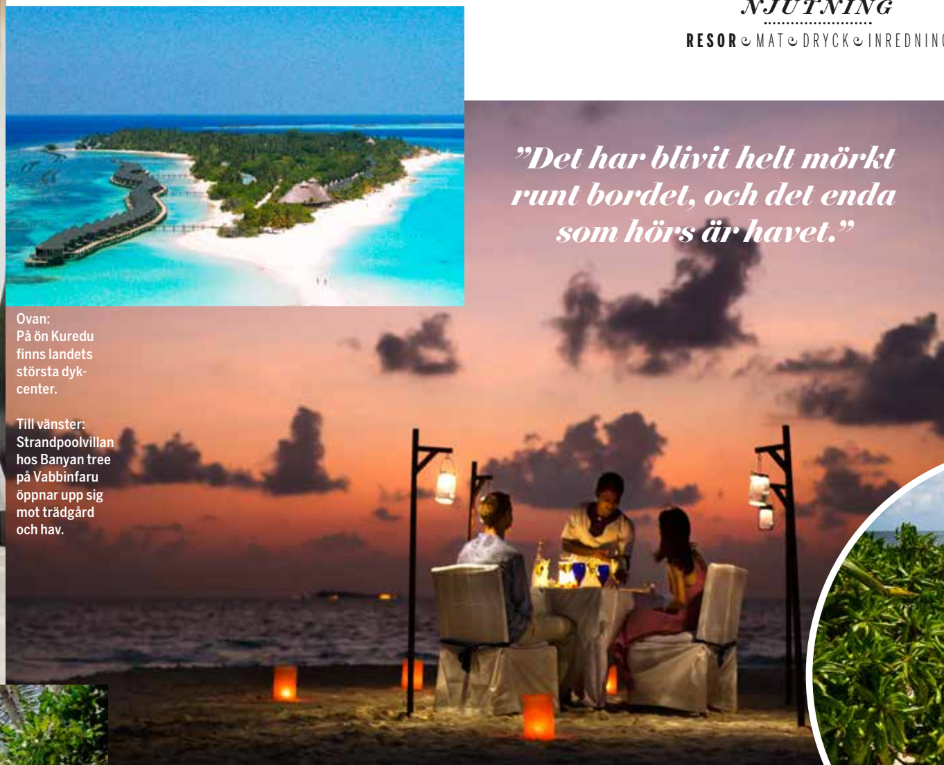
Till vänster: Strandpoolvillan hos Banyan tree på Vabbinfaru öppnar upp sig mot trädgård och hav.

"Det har blivit helt mörkt runt bordet, och det enda som hörs är havet."