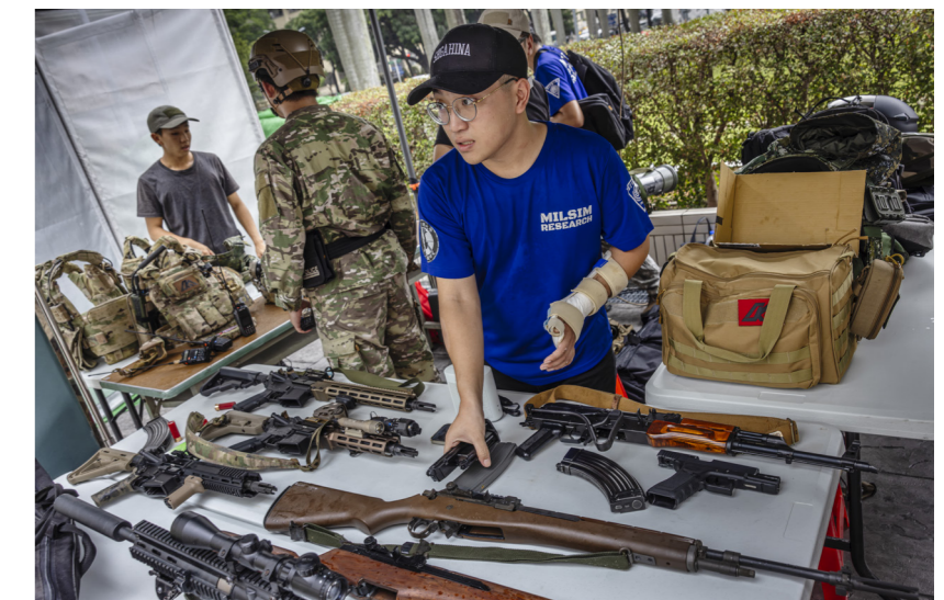
Studenterna får provskjuta och prova vapen när försvarsgruppen Taichung – STA Defence, håller träning utanför deras universitet.