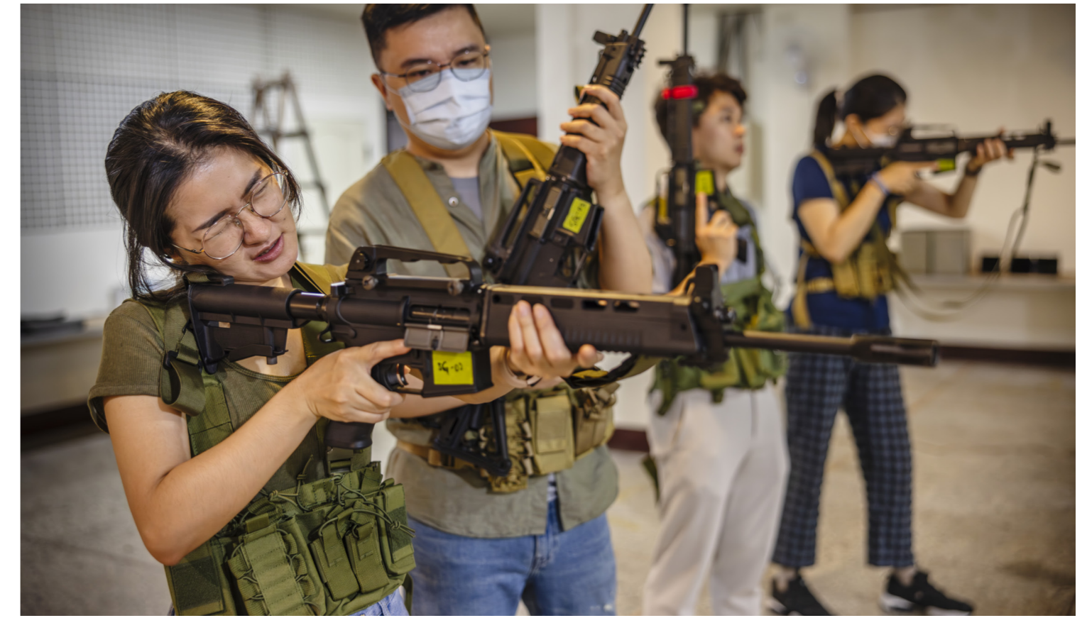
En ung kvinna i gruppen Taiwan Hemlock Civil Defence, och tränar på att sikta med ett vapen