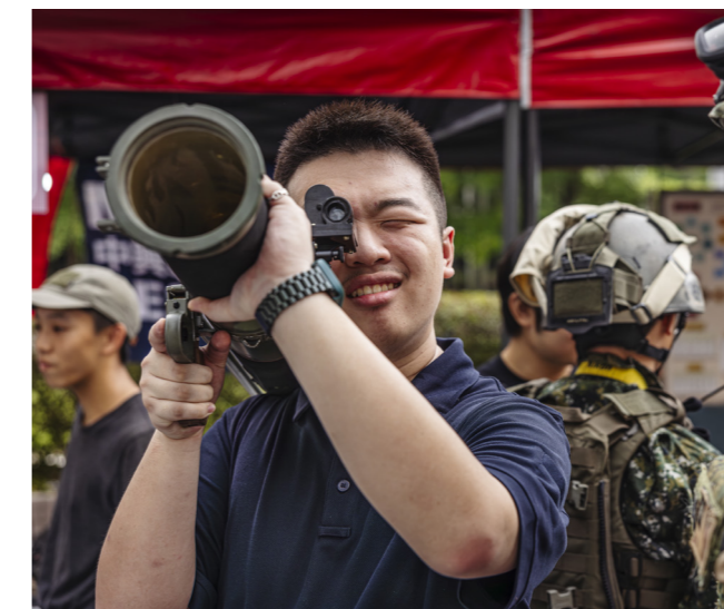
I nuläget har Taiwan runt 180 000 aktiva i sin militär och ytterligare runt två miljoner reservister.