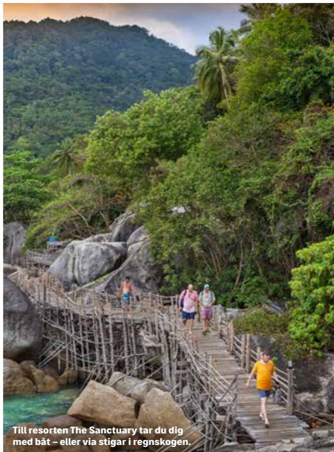
Till resorten The Sanctuary tar du dig med båt – eller via stigar i regnskogen.

”Den tidigare festön lockar mer och mer till sig resenärer som under veckor, eller till och med månader, kommer hit för ’att dyka in i sig själva’ ”