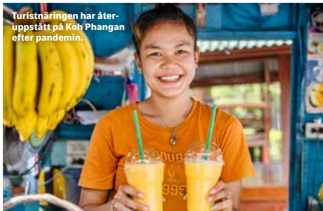
Turistnäringen har återuppstått på Koh Phangan efter pandemin.