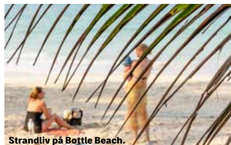
Strandliv på Bottle Beach.

Sägs vara öns bästa strand, och den känns öde utan många besökare. Det finns en stig genom djungeln för att ta sig hit, men en båttur är att rekommendera för att få en blick från havet in mot stranden.