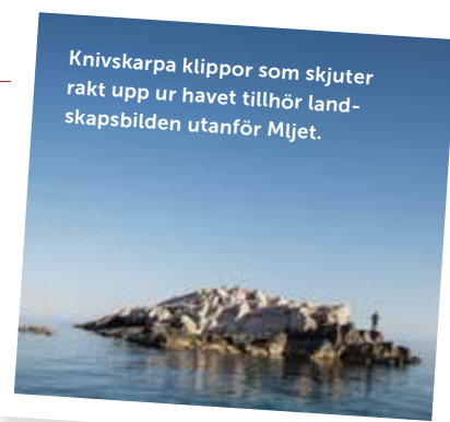
Knivskarpa klippor som skjuter rakt upp ur havet tillhör landskapsbilden utanför Mljet.

KORCULA: Marko Polo Hotel by Aminess ligger en kort promenad från Korculas gamla stadsdelar. En lyxig pool har utsikt över staden. Vill du ta det ännu lugnare är det bara att utnyttja wellness-avdelningen med spa och olika behandlingar. Kostar runt 1 800 kr för ett dubbelrum. aminess.com/en/marko-polo-hotel-by-aminess