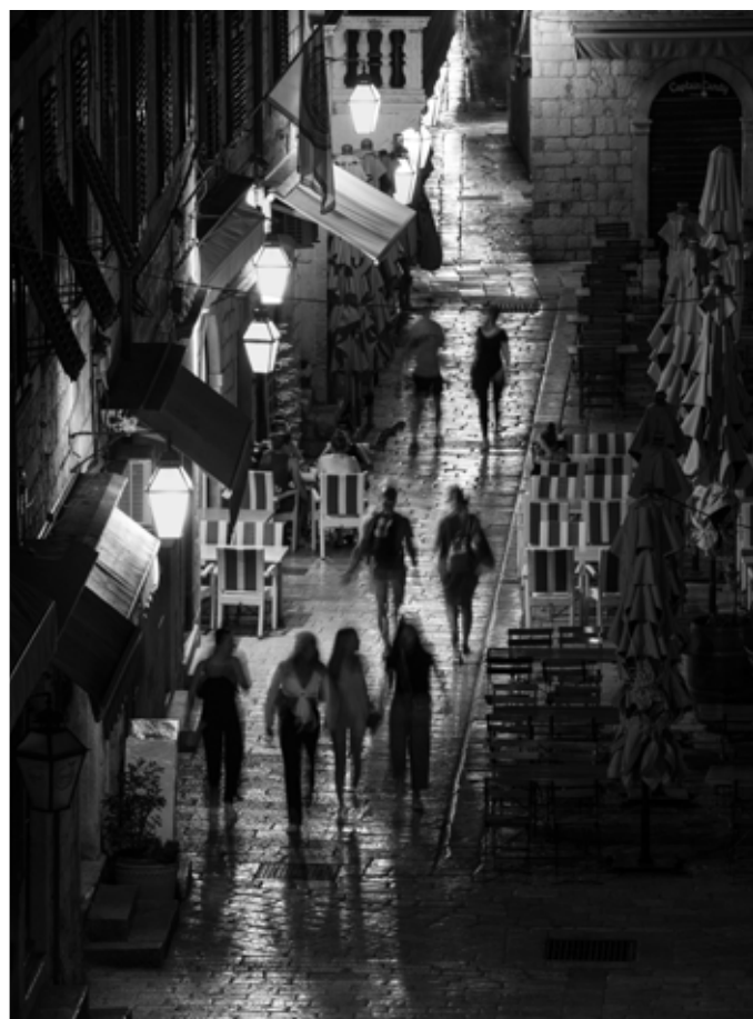
Det tar tid att laga en traditionell peka, men varför stressa? (t v) Upplysta gator, med vimmel in på småtimmarna, tillhör den kroatiska stadsbilden. (t h)