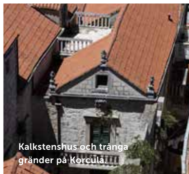
Kalkstenshus och tränga gränder på Korcula