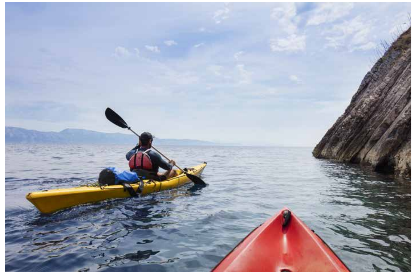
Kajakpaddling är nästan ett måste om man vill komma nära havsmiljön utanför Mljet.

Ta en elcykel genom Korculas bergiga landskap med en guide som knappast backar från nya utmaningar som branta stentrappor!