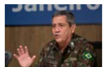
Walter Souza Braga Netto.

Brasilien: Brasiliens före försvarsminister Walter Braga Netto har gripits i samband med anklagelser gällande att ha planerat en statskupp. Anklagelserna mot honom gäller att han ska ha hindrat insamling av bevis, säger den federala polisen i ett uttalande. Myndigheterna genomförde också två husransakningar i samband med gripandet. Braga Netto anklagades förrmolt i november, tillsammans med den tidigare presidenten Jair Bolsonaro och 35 andra, för att ha planerat en statskupp för att hålla Bolsonaro kvar på posten efter hans misslyckade omval 2022. Braga Netto var Bolsonaros stabschef från 2020 till 2021 och försvarsminister från 2021 till 2022. Hans juridiska företrädare har tidigare sagt att de kommer att vänta med uttalanden tills de har hunnit granska polisdokumenten. (TT-AP-AFP)