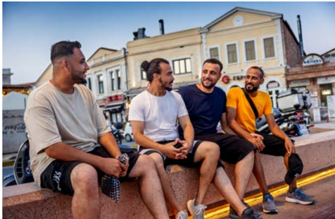
En grupp av fyra unga syriska män har varit på Lesbos i en månad. De beskriver Syrien under Bashar al-Assad som kaotiskt och utan framtidssutsikter. "Det är bara kaos och där finns inga pengar," säger en av dem, som siktar på att bli bilmekaniker i Tyskland.

Att det kommer allt färre migranter till Lesbos råder det ingen tvekan om, det syns även tydligt kring flyktinglägret alldeles i utkanten av Mytilene dagen därpå. För närvarande finns det runt 800 flyktingar i lägret, en kraftig minskning från de omkring 6 000 som fanns där i början av året. I närheten arbetar många hjälppositioner med att göra livet så lätt som möjligt för de nyanlända. Paréa Lesvos är en hubb som består av sammanlagt elva organisationer uppe på en kulle – som överblickar lägret och havet nedanför. – Från mars skickades många