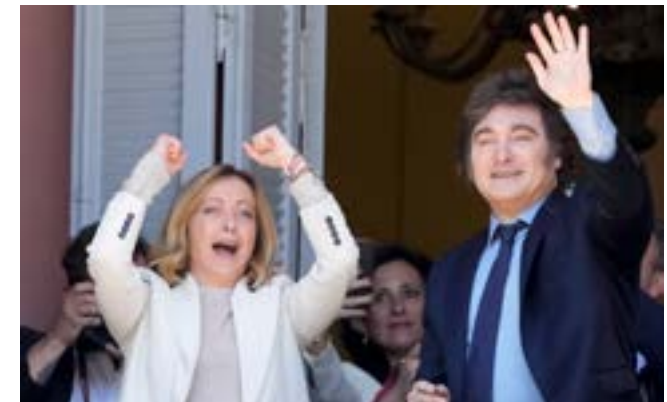
Italiens premiärminister Giorgia Meloni och Argentinas president Javier Milei. Bild från november i år.