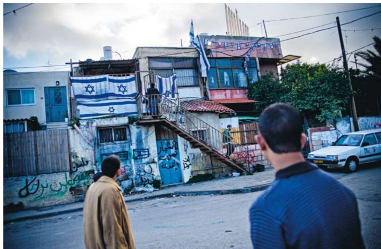
UTSPARKADE. Palestinierna betraktar sitt eget hus som numera tillhör judiska bosättare.