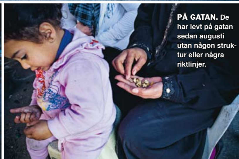
PÅ GATAN. De har levt på gatan sedan augusti utan någon struktur eller några riktlinjer.