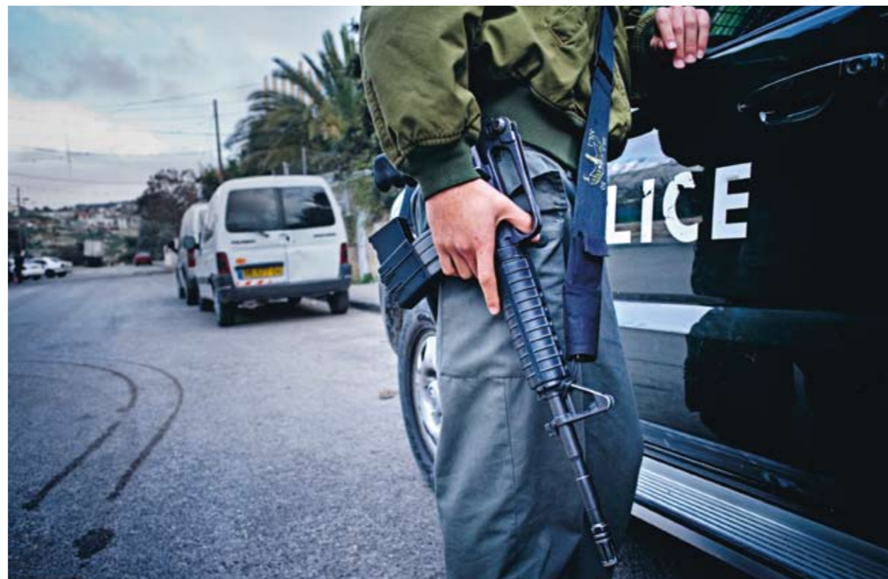
POLISEN. Militärer patrullerar gatan och parkerar sin bil en bit från det ockuperade huset.