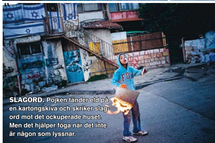
SLAGORD. Pojken tänds eld på en kartongskiva och skriker slagord mot det ockuperade huset. Men det hjälper föga när det inte är någon som lyssnar.