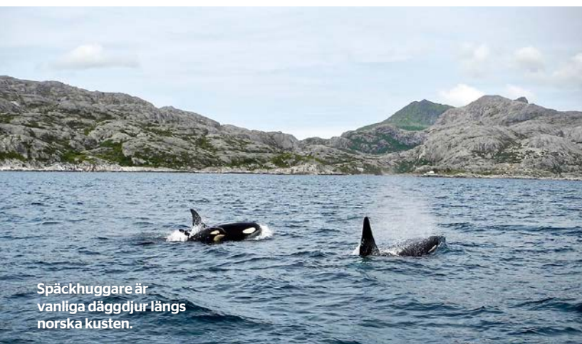
Späckhuggare är vanliga däggdjur längs norska kusten.