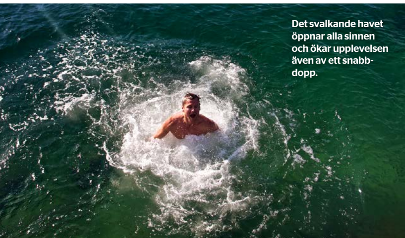
Det svalkande havet öppnar alla sinnen och ökar upplevelsen även av ett snabbdopp.