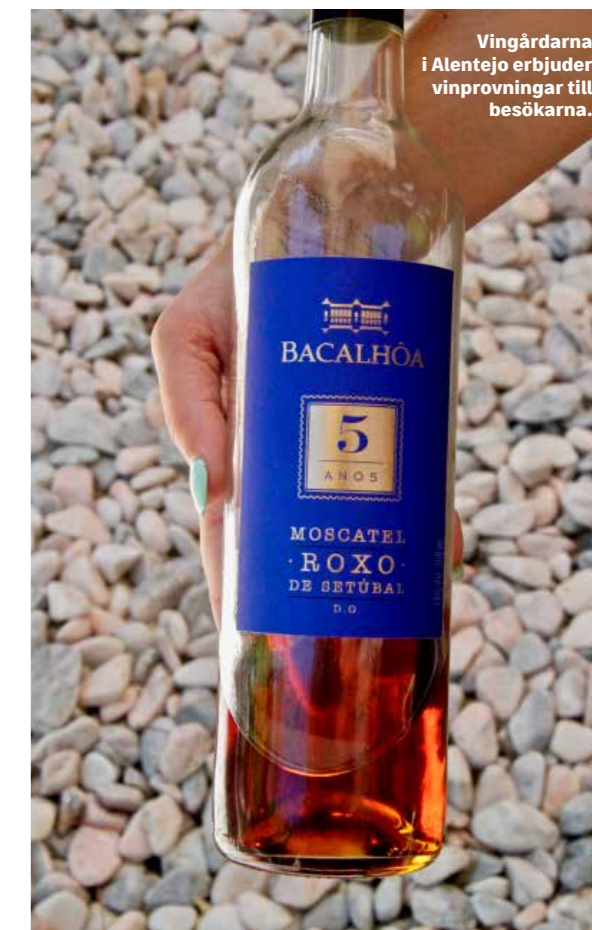
Vingårdarna i Alentejo erbjuder vinprovningar till besökarna.