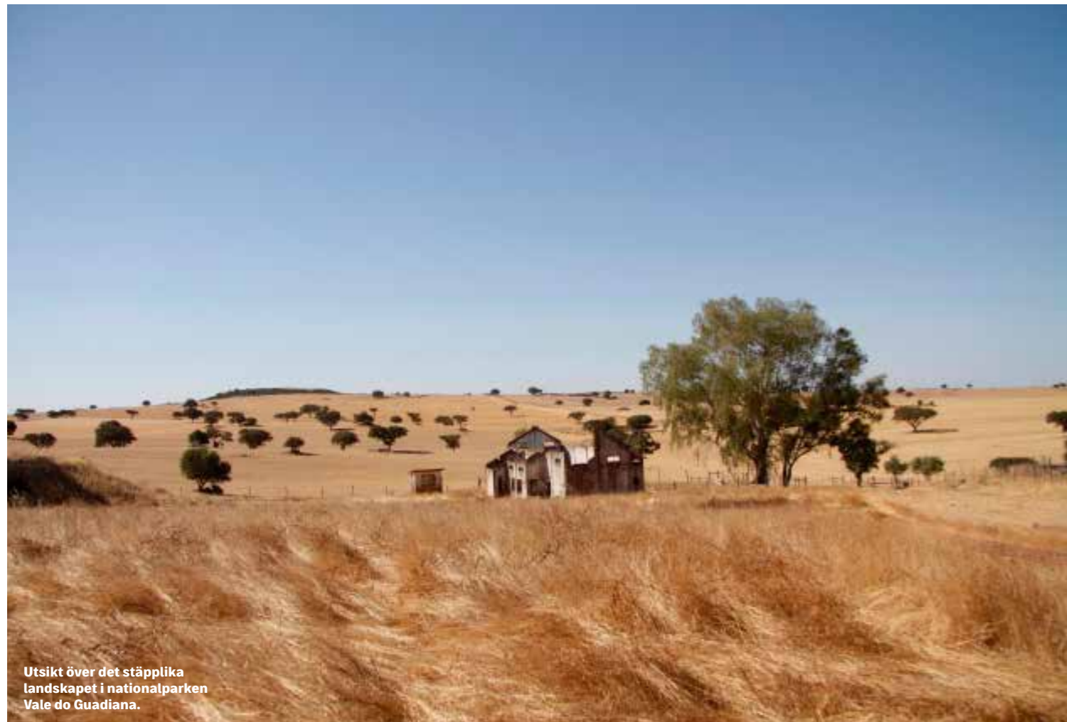
Utsikt över det stäpplika landskapet i nationalparken Vale do Guadiana.

”I det torkade landskapet är gräset gult och har inte sett regn på flera månader. Vandrigen följer en smal viltstig in i busklandskapet”