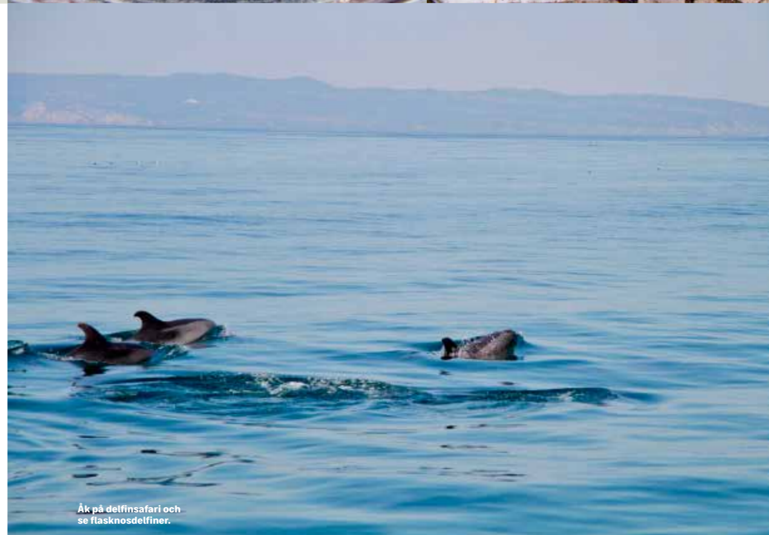
Åk på delfinsafari och se flasknosdelfiner.

Fortfarande utgör emellertid fisk och skaldjur en stor del av det portugisiska köket och kulturen, och det blir tydligt i Arrábidas kuststad Sesimbra, där fiskebåtarna i generationer har puttrat in med färsk seafood som sedan serveras på någon av byns berömda fiskrestauranger. På Café Filipe serveras bläckfisksallad med upphackad röd paprika och »