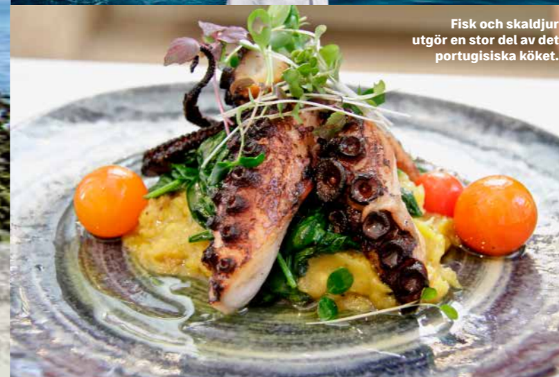
Fisk och skaldjur utgör en stor del av det portugisiska köket.