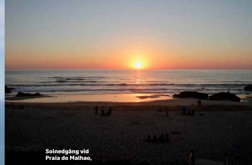
Solnedgång vid Praia do Malhao,

I Alentejo är vin en stor del av kulturen. Regionen har framför allt fruktiga röda viner.