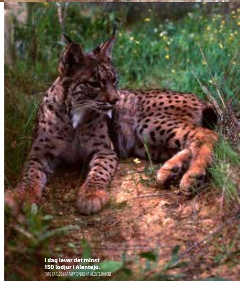
I dag lever det minst 150 lodjur i Alentejo.