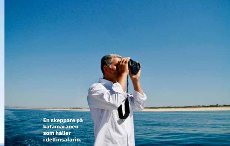
En skeppare på katamaranen som håller i delfinsafarin.