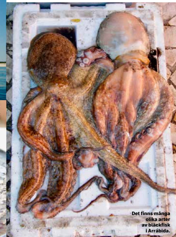
Det finns många olika arter av bläckfisk i Arrábida.

”Nationalparken Arrábida har vandringsleder längs klippväggar som stupar rakt ner i Atlanten, och gömda stränder som enbart lokalbor hittar till”