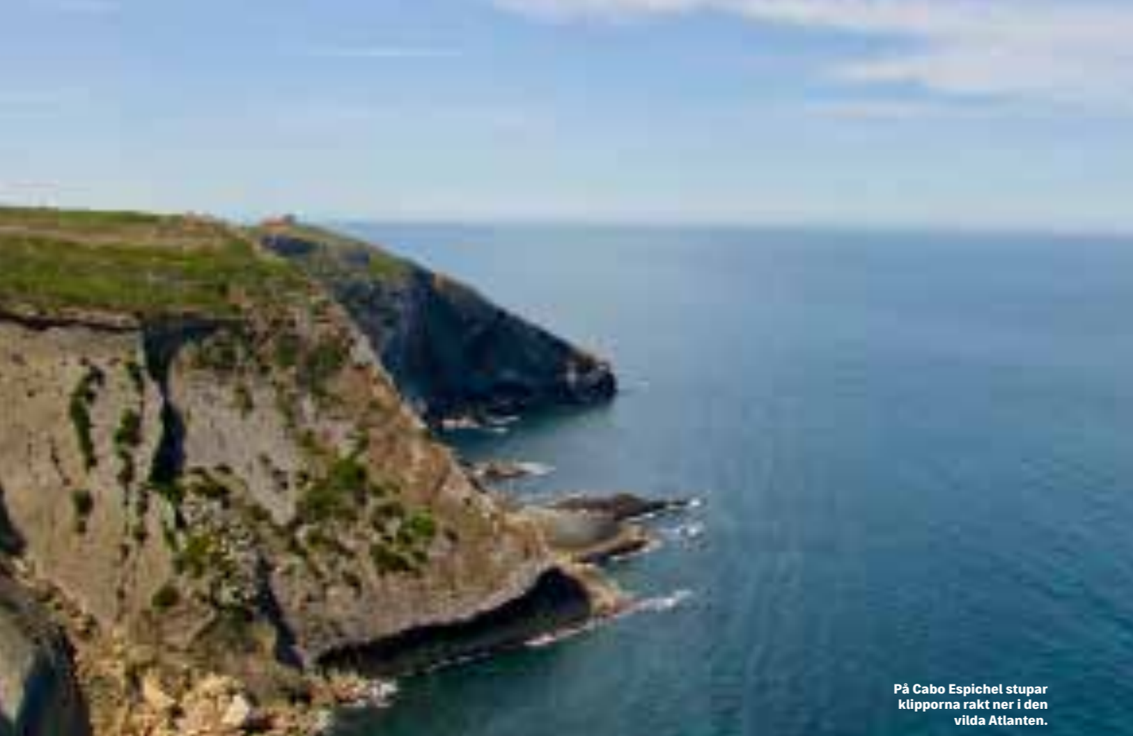
På Cabo Espichel stupar klipporna rakt ner i den vilda Atlanten.