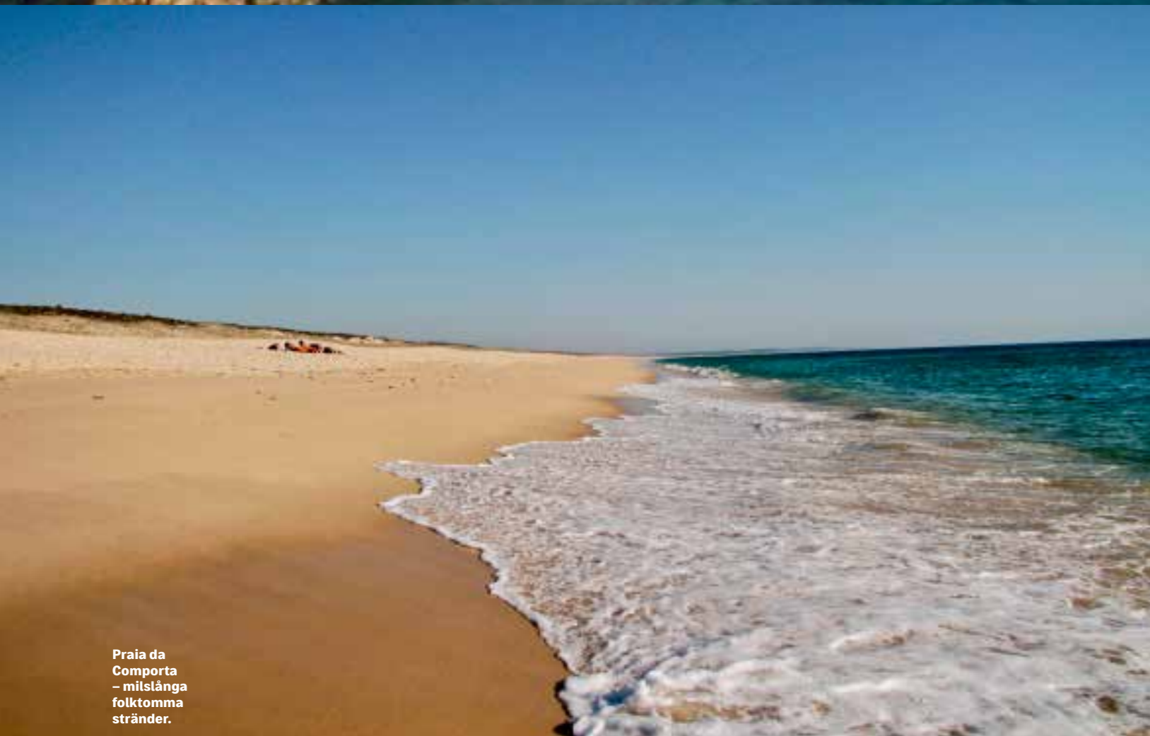
Praia da Comporta – milslånga folktomma stränder.