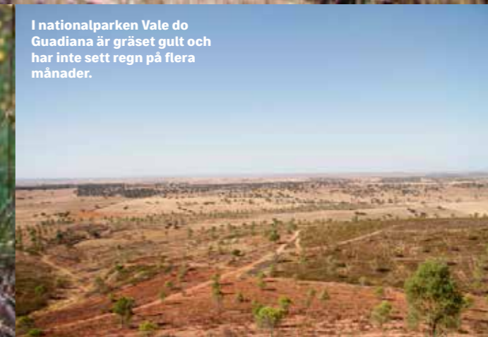
I nationalparken Vale do Guadiana är gräset gult och har inte sett regn på flera månader.