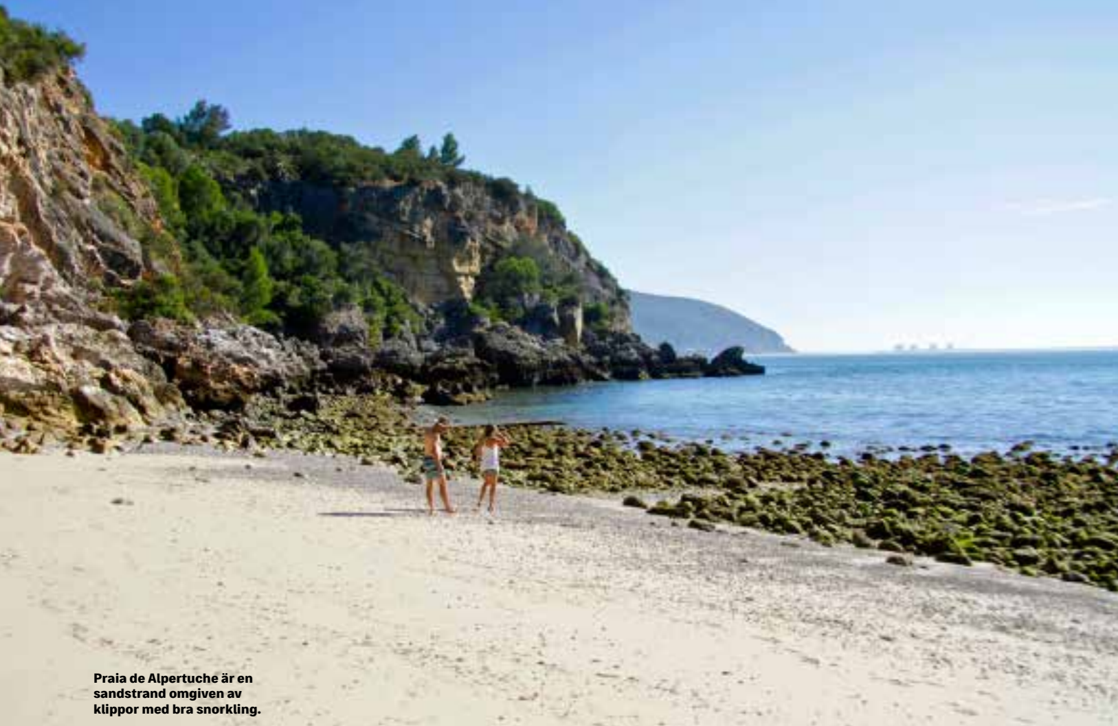
Praia de Alpertuche är en sandstrand omgiven av klippor med bra snorkling.