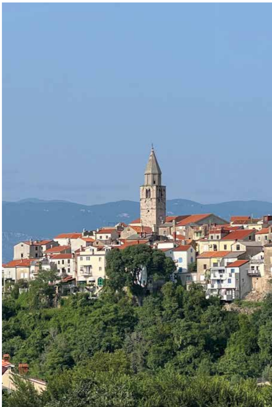
▲ KRK: Den koselige byen Krk kan by på mange pittoreske, små lommer

Hver av deltakerne, stort sett fra Tyskland og Ukraina, får nå utdelt utstyr slik at de kan snorkle. Siktedypet er imponerende, og det yrer av småfisk. De store holder seg lengre ute, forklarer Bernard.