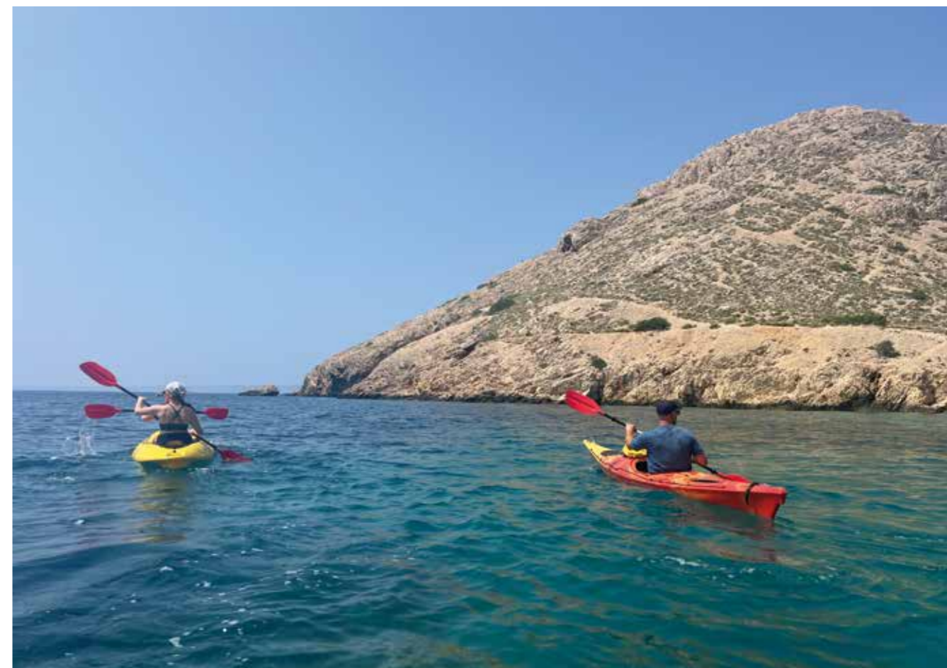
▲ Herlig: Både Kroatia og Slovenia anbefales hvis du er ute etter paddeeventyr.