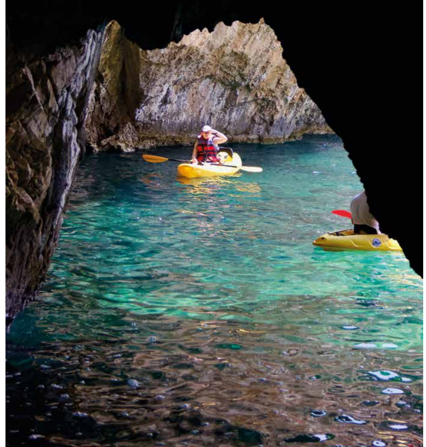
▲ Lokker: Det er noe med åpninger i fjellet – man må nesten padle inn.

Noen dype grotter er dagens neste stopp og vi er ikke de eneste som foretrekker mørket. Her bor også flere flaggermusfamilier.