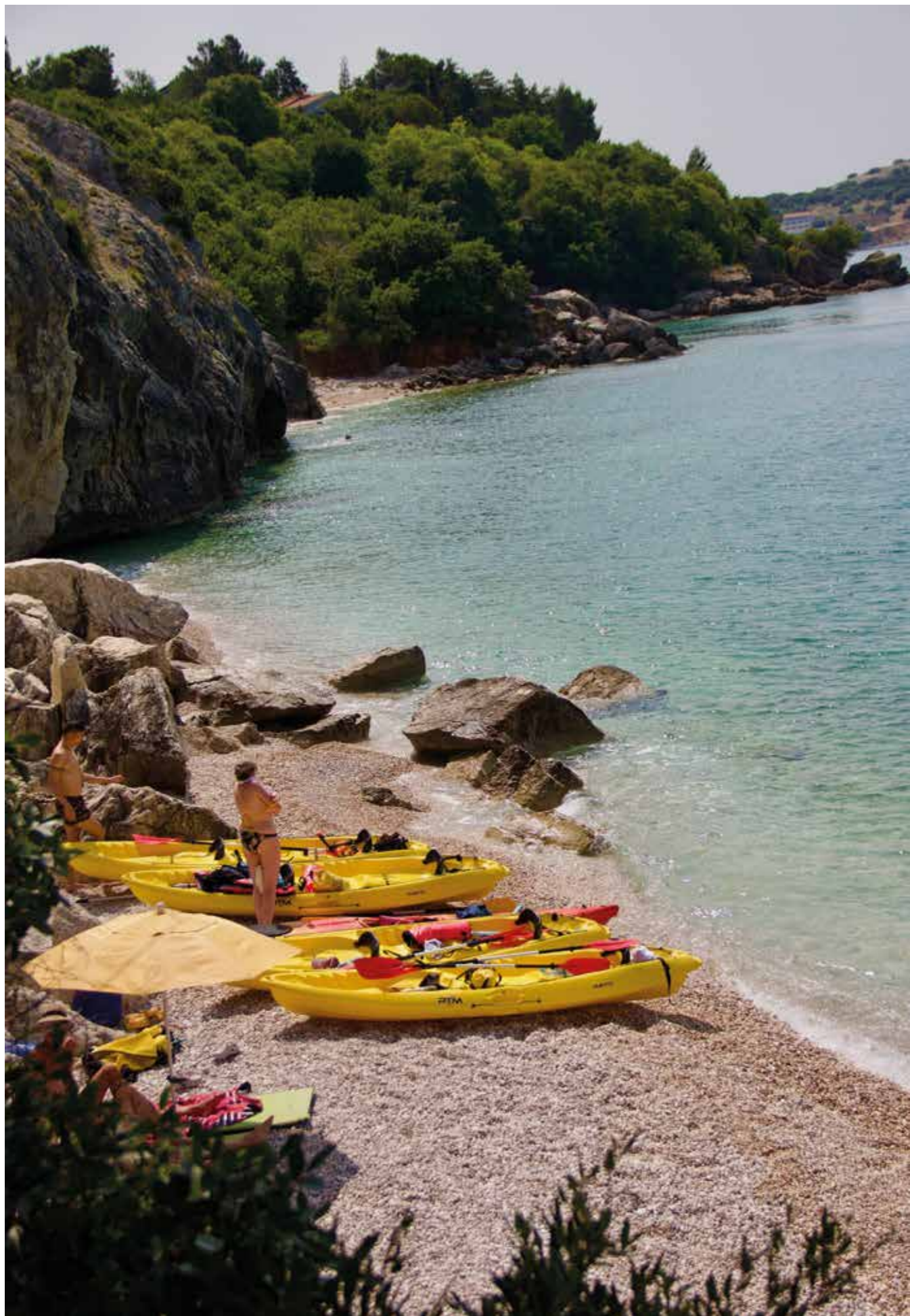
▲ En dag på stranda: Etter mørke og litt nifse opplevelser er det ok å puste ut og nyte varmen.