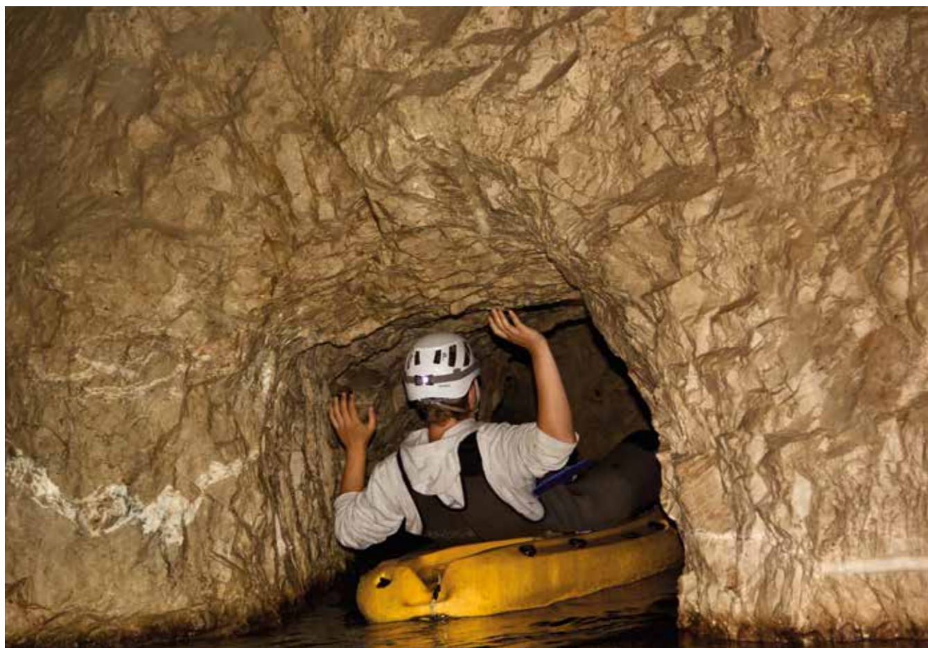
▲ Inn i mørket: Inne i grottene er det både kaldt, mørkt og trangt.