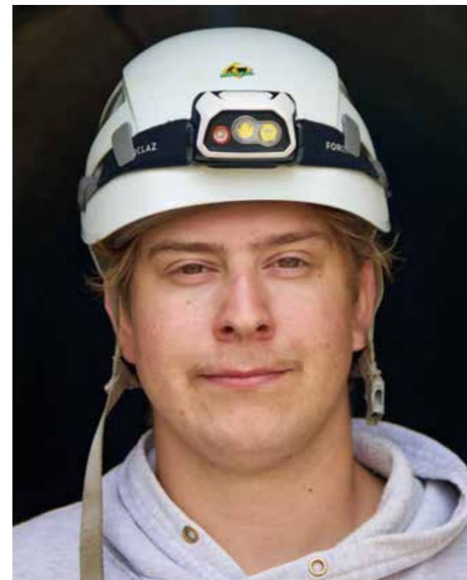
▲ Så hatten passer. Hjelmer er nødvendig når en skal padle inn i smale, lave grotter der stein kan løsne fra taket.