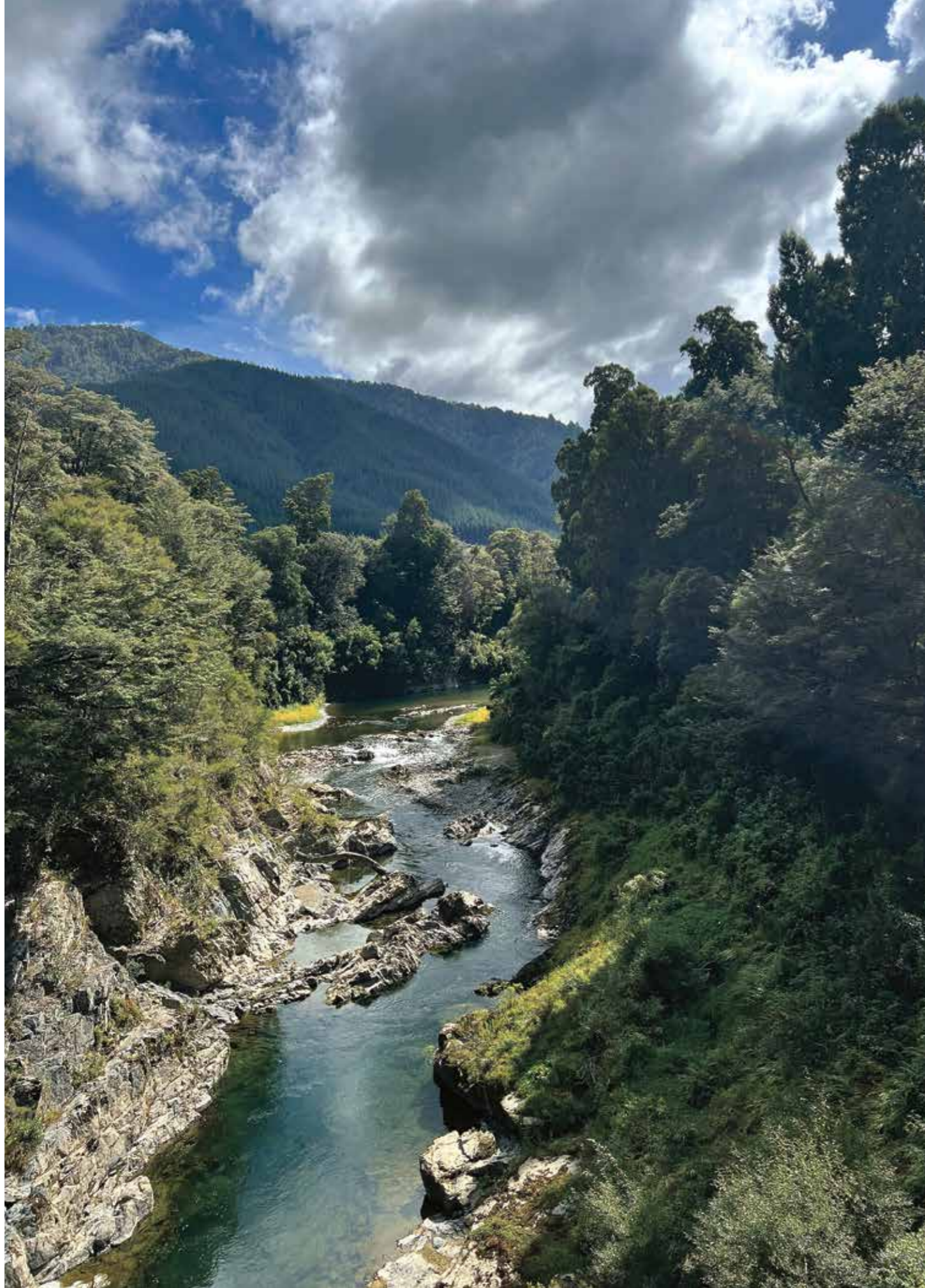
▲ Ringenes Herre: Elven Pelorus byr på stryk, fosser og vakker naturlig skog. Dette distriktet ble benyttet i innspillingen av Hobbit-filmene.