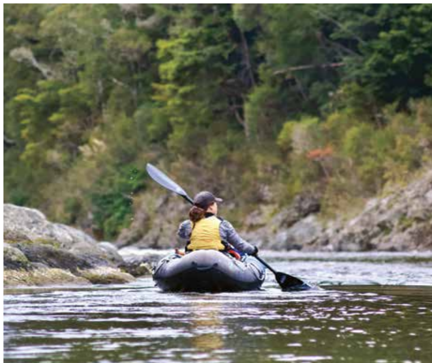
▲ Hysj: Stillheten er en del av helhetsopplevelsen i Marlborough-regionen.

nedstrøms i Pelorus-elven. Siden det ikke har regnet på lenge, er elva grunn og vi kan se gjennom det klare vannet helt til sandbunnen. Vi har padlet i rolig tempo. Det er som om Jade har lest tankene mine.